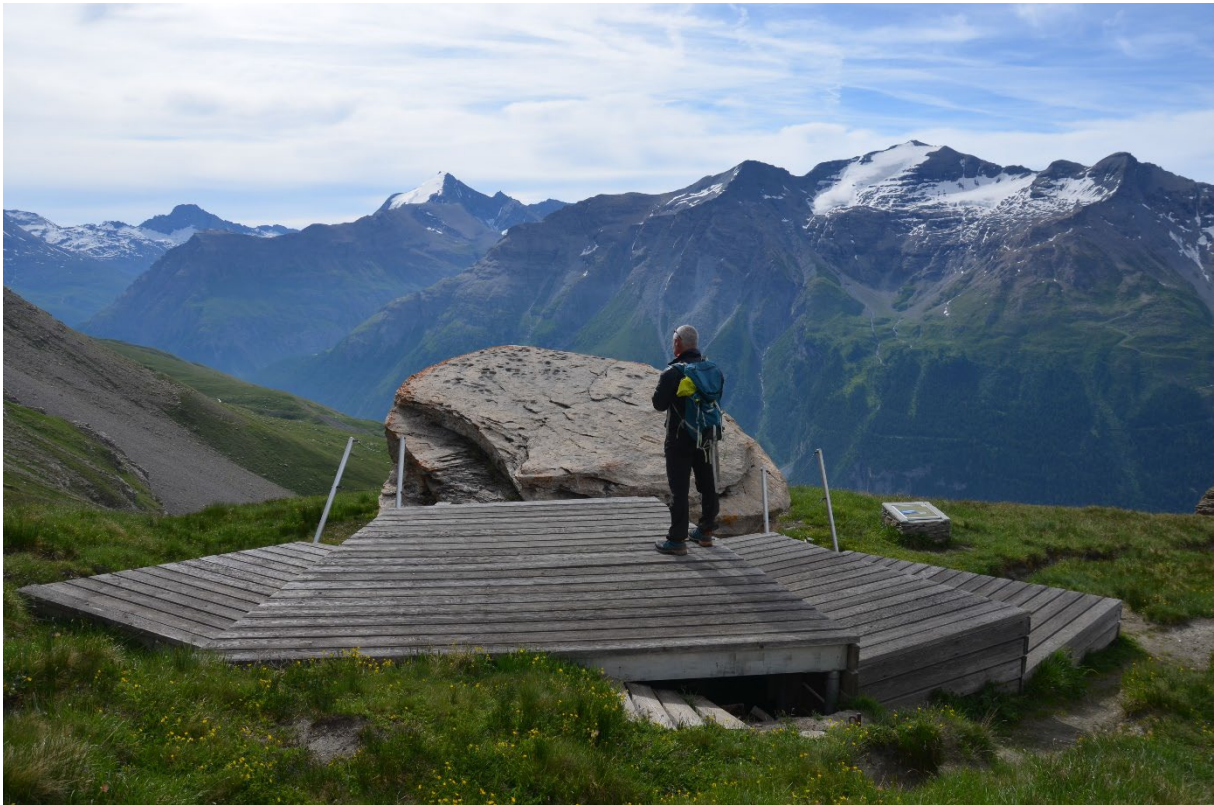
Figure 2 : aménagement réalisé à la Pierre aux Pieds en 2000, roche gravée située au-dessus de Lanslevillard, juillet 2019.

des acteurs locaux en charge des questions patrimoniales sur les enjeux de préservation et de valorisation des sites d'art rupestre. Sur la base de ce premier travail, un second mémoire de Master 2 (Collange, 2020) a permis de conduire de nouveaux entretiens semi-directifs avec les structures de gouvernance et les élus, ainsi qu'avec les professionnels du tourisme. L'objectif était d'aborder les enjeux liés à la préservation et à la valorisation des sites d'art rupestre sous l'angle de la « ressource », tout en les contextualisant au regard de l'économie des sports d'hiver.