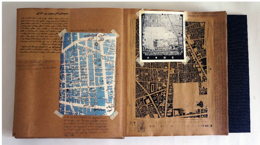
Figure 2 : Le livre de l'effacement de la citadelle.