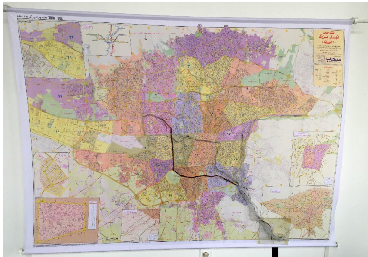
Figure 5 : La carte des invisibles.