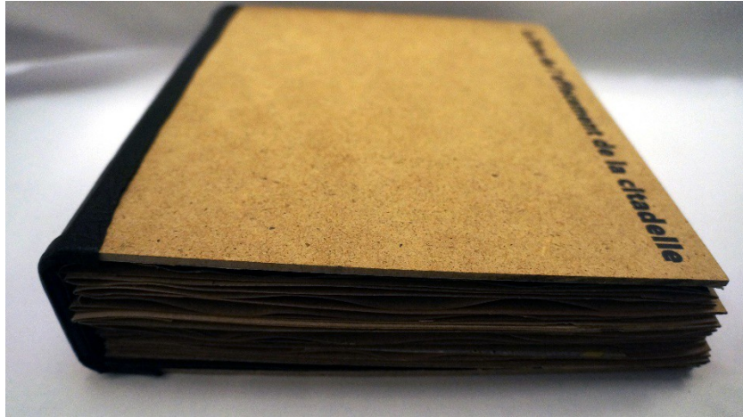
Figure 1 : Le livre de l'effacement de la citadelle. Bois/kraft/cuir. 26 x 22 cm. Livre Leporello. 40 pages.