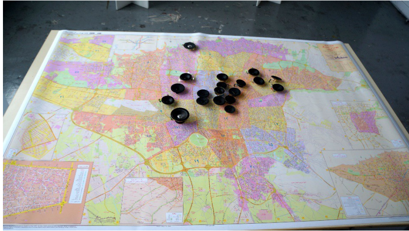
Figure 3 : La carte des absent-e-s. Bâche vinyle. 120 x 170 cm. Carte étalée sur une ou deux tables en bois de mêmes dimensions, trouées en dix-neuf endroits afin de laisser passer les câbles des haut-parleurs.