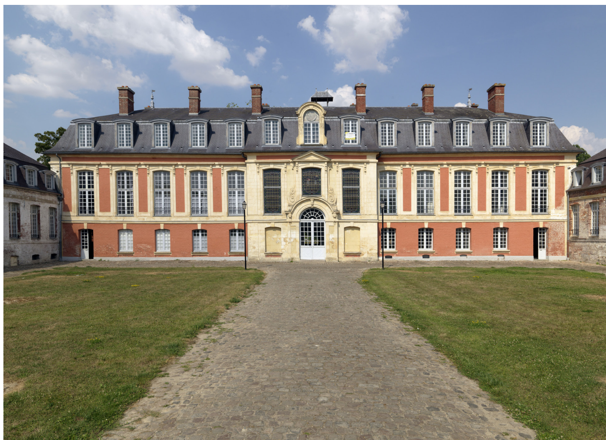
1 – Vue de la façade sur cour de l'ancienne demeure patronale – dite hôtel Van Robais – de la manufacture des Rames.