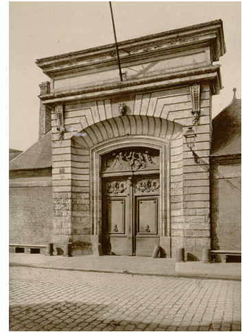
2 (page de gauche) – Manufacture royale de draps fins d'Abbeville et moulin à foulon de Blangy-sur-Bresle (Seine-Maritime), calque tiré d'un dessin de E. Fortin, 1862. Impression Thierry frères (Paris). Archives municipales d'Abbeville, fonds Macqueron 1Fi19/25.

Le corps de logis est placé en fond de cour à la manière d'un « hôtel particulier 12 » à la française et s'élève sur un niveau de caves. Il comporte un