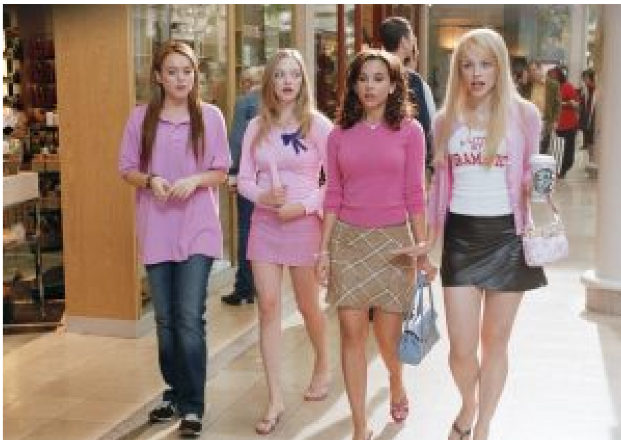
Mean Girls , 2004. Réalisé par Mark Waters. Produit par Paramount Pictures (États-Unis).

nombreuses productions culturelles ont repris ce discours en mettant en scène des héroïnes hyperféminines dont la caractéristique immédiatement reconnaissable est leur attrait pour le rose. C'est le cas notamment d'Elle Woods dans le film Legally blonde (Luketic, 2001), de Cady Heron dans Mean Girls (Waters, 2004), ou de Chanel Oberlin dans la série Scream Queens (Twentieth Century Fox, 2015-2016). À chaque fois, il est question d'une jeune femme caricaturalement féminine, tant dans ses tenues (roses le plus souvent) que dans son attitude ou ses centres d'intérêt (la mode, séduire les garçons, etc.), et qui en dépit de cela — et mieux, grâce à cela — parvient à occuper et maintenir une position d'empowerment.