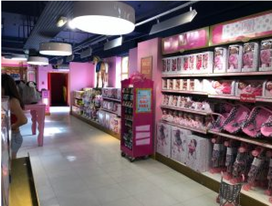
Vue du magasin de jouets Hamley, Londres, 2018.

Les dessins animés, en relation étroite avec l'univers des jouets – qui en sont bien souvent issus –, participent également à renforcer l'association du rose au féminin. De la pilote automobile Penelope Pitstop de Wacky Races (Hanna-Barbera, 1968-1969), à la Princess Bubblegum d' Adventure Time (Cartoon Network, 2010-2018), en passant par la magicienne Sakura Kinomoto de Cardcaptor Sakura (Madhouse, 1998-2000), nombreux sont en effets les personnages féminins – humains ou non – à avoir des vêtements roses, les cheveux roses, le corps rose ou à posséder des accessoires roses, ce dans des productions animées de différents pays, et dédiées à différentes catégories d'âge. Ainsi le rose met-il en évidence – avec d'autres éléments plastiques (coupe des vêtements, cils longs, etc.) – des personnages féminins auxquels les filles peuvent s'identifier, dans des univers où les personnages masculins sont en moyenne trois à quatre fois plus nombreux (Lallet, 2014).