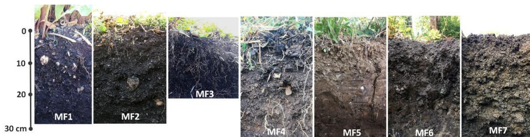
Figure 2 : Profils de sol des différents sites d'étude en octobre 2018. Soil profile of the different urban micro-farms (October 2018).