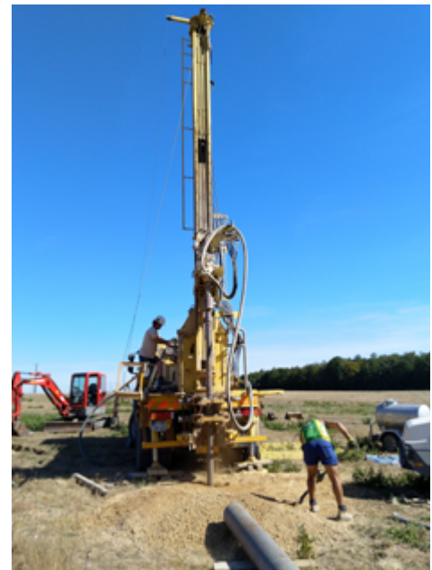
1 - Foration du site de Gouttières (27), le 5 août 2020, par le BRGM (L. Ardito et M. Parrella) pour la future station GOTF de Résif-RLBP - crédits D. Fligel/P. Gernigon, Osuna.

Jérôme Vergne, Eric Beucler, Olivier Charade