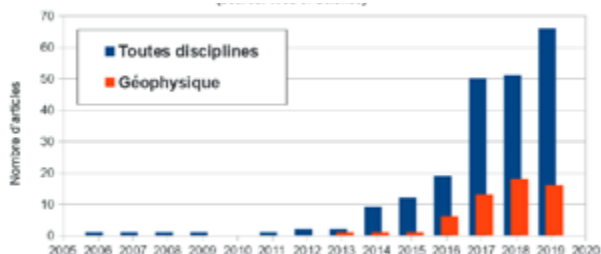
1 - Evolution du nombre de publications sur le DAS dans la littérature scientifique en général, et en géophysique en particulier.