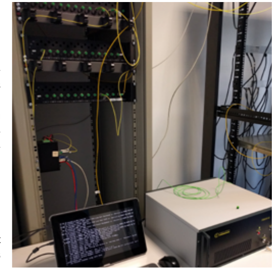
2 - Photo du système DAS de Febus Optics durant une mesure sur le câble fond de mer MEUST-NumerEnv au large de Toulon

En résumé, le DAS est une technologie qui a déjà démontré sa capacité à s'affranchir de plusieurs contraintes de l'instrumentation sismologique traditionnelle et devrait apporter un nouvel éclairage (sic) sur une multitude de processus. Un travail important est en cours au sein de la communauté internationale et nationale pour adapter les