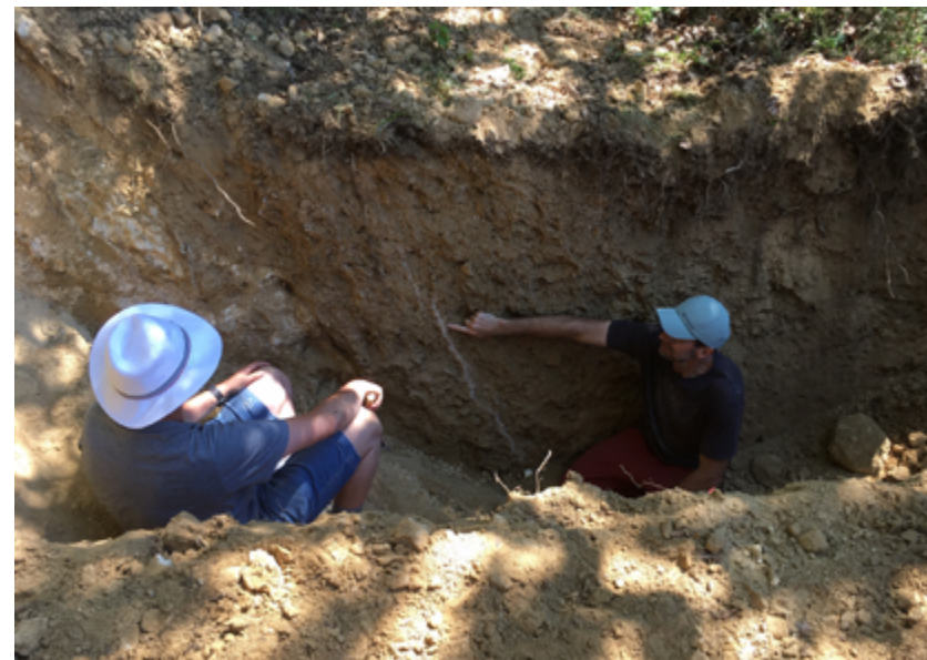
1 - L'une des tranchées creusées sur la section nord de la faille de la Rouvière. La bande blanche verticale pourrait être une trace d'une activité sismique antérieure.

Pour répondre aux questions qui se posent, des investigations paléosismologiques, soutenues notamment par un financement du programme Insu-Tellus, ont été lancées depuis le mois de Juin 2020 sur l'ensemble du réseau nord-est cévenol. Une quinzaine de tranchées ont d'ores et déjà pu être réalisées au niveau