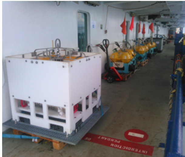
1 Le capteur A0A Résif et OBS Insu-IPGP prêts à être déployés sur le pont.