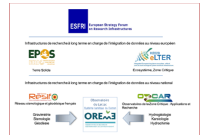
L'observatoire du Larzac et les IR impliquées - 2021

Données Oreme : data.oreme.org/observation/gek SNO H+ : hplus.ore.fr/ Ozcar : www.ozcar-ri.org/ eLTER : www.lter-europe.net/ Réseau ZAE Inee : www.za-inee.org/