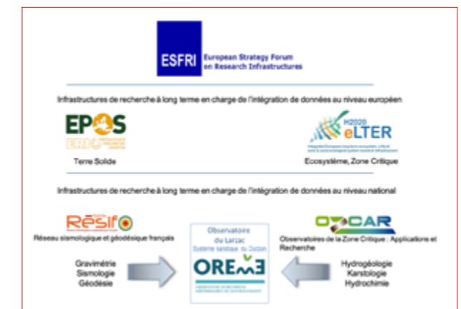
L'observatoire du Larzac et les IR impliquées - 2021

Données Oreme : data.oreme.org/observation/gek SNO H+ : hplus.ore.fr/ Ozcar : www.ozcar-ri.org/ eLTER : www.lter-europe.net/ Réseau ZAE Inee : www.za-inee.org/