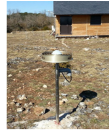
3- Station GNSS Résif-Rénag HOLA, 2017 Crédits : S. Baudin - En savoir plus : hal.archives-ouvertes.fr/RESIF/hal-03207751

Les déformations du Causse du Larzac sont actuellement en cours d'étude préliminaire dans le nouveau Service national d'observation ISDeform du CNRS.