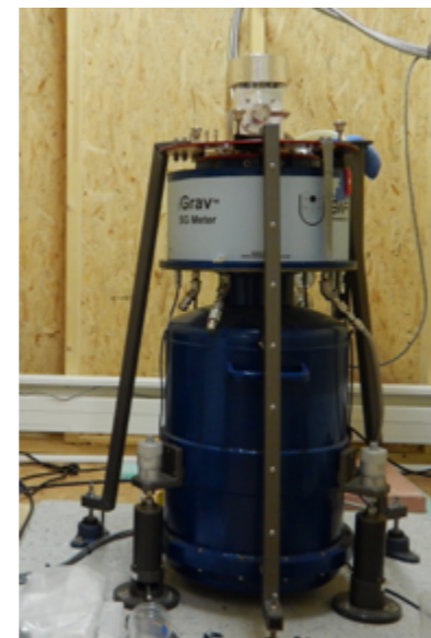
2- Gravimètre supraconducteur iGrav, 2019 - En savoir plus : hal.archives-ouvertes.fr/RESIF/hal-03206882

Un gravimètre supraconducteur iGrav#002 GWR 2 , intégré au réseau gravimétrique permanent Résif, mesure en continu depuis 10 ans la pesanteur terrestre et les variations du bilan de masse.