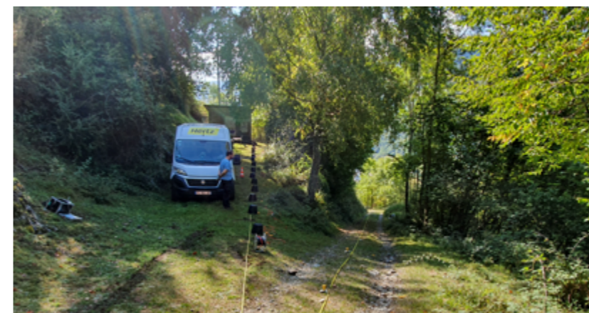
3- Manipes de caractérisation des conditions de sites aux stations RAP. Mesures MASW aux stations PYCA le 20 septembre 2019 (à gauche) et CGLR (à droite). L'acquisition en ligne est déployée à proximité immédiate de la station permanente.