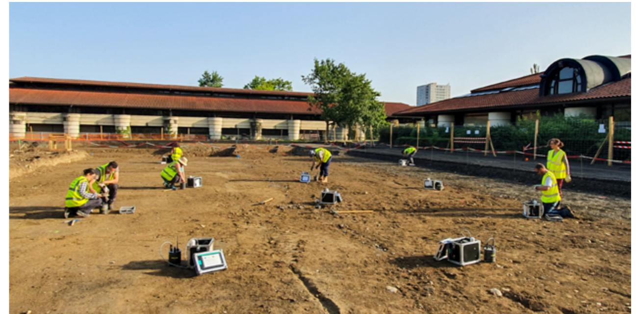
2- Manipe de caractérisation des conditions de sites aux stations RAP. Mise en place des petits réseaux circulaires AVA de rayons 5 et 15 m près de la station PYTB à Tarbes, dans les Pyrénées, le 16 septembre 2019