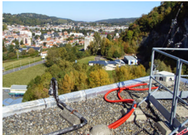
1— La station PYTO du RAP, installée à Lourdes dans les Hautes-Pyrénées, est une antenne de 24 capteurs qui instrumentent depuis 2008 la Tour Ophite, tour d'habitation de 20 niveaux. La photographie montre deux des capteurs installés sur le toit. Ce dispositif est répété en deux autres points du toit, puis dans les différents étages de la tour jusqu'au sous-sol, ce qui permet de mesurer la déformation du bâtiment sur toute sa hauteur et d'étudier sa réponse aux sollicitations sismiques.

Le RAP est un service national d'observation du CNRS-Insu et intègre l'infrastructure de recherche Résif-Epos. La maintenance du réseau est assurée par l'ensemble des partenaires du RAP. Certaines stations sont opérées en commun avec le Réseau Large-Bande Permanent (RLBP), aux sites permettant de faire coïncider les objectifs scientifiques des deux réseaux. Le pilotage national du RAP est assuré par sa direction basée à l'ISTERre (Osug) de Grenoble. Le RAP national se charge de collecter les données accélérométriques acquises par toutes les stations du réseau, met à jour et maintient la base de données nationale qui en découle (nœud A RAP du système d'information Résif [5]), fournit un support technique aux réseaux régionaux et veille à maintenir les stations à la pointe de la technologie.