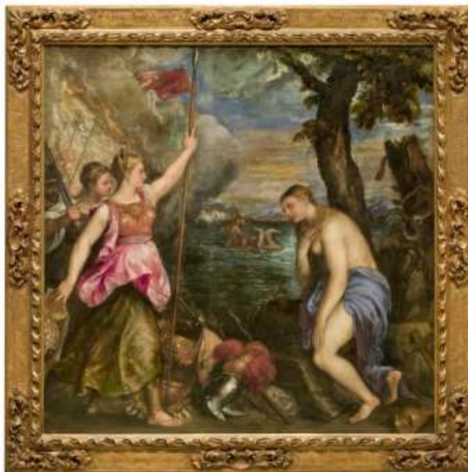
Fig. 1. La religión socorrida por España , Ticiano, museo del Prado.

Ahora bien, volviendo a la Inquisición, los venecianos no parecen rechazar ni su omnipotencia ni su omnipresencia; por eso insisten con tanta constancia en sus severos métodos. Poner de relieve el papel relevante de la Inquisición española es de hecho un recurso más de los diplomáticos para desconsiderar a la Corona de España. Opinan en efecto que está bajo el yugo de tal institución mientras que, en la República de Venecia, el Estado protege sus prerrogativas dejando al clero apartado de los asuntos públicos (Lane, 519). El Patriarca y los altos dignatarios son designados por el Senado. La Inquisición no puede detener a sospechosos sin el visto bueno del Consejo de los Diez (Ioly Zorattini, 70) y solo puede reunirse en presencia de tres laicos, los Savii contro l'Eresia . 13