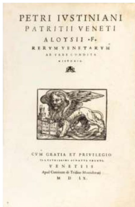
Fig. 3. Rerum venetarum (1560), Pietro Giustiniani.

Pietro Giustiniani escribió Le historie venete (1576), primero en latín (1560).