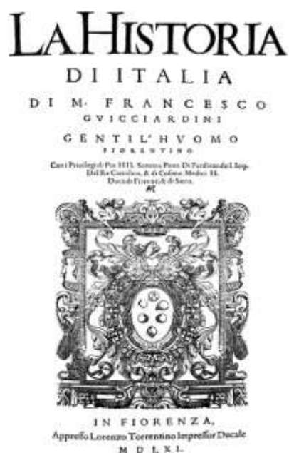
Fig. 5. La historia di Italia (1561), Francesco Guicciardini.

Por fin recordemos que algunos autores italianos se lucieron minusvalorando los hechos de Colón y de los conquistadores 20 (Ramusio; Benzoni), insistiendo en la ignorancia y la debilidad de los autóctonos, y denunciando la brutalidad de los españoles. De hecho, en los textos italianos –que evoquen el saco de Roma, la conquista del Nuevo Mundo, la guerra de Flandes o de las Alpujarras o la acción demoleadora de la Inquisición– el adjetivo recurrente para calificar a los españoles es “bárbaro”.