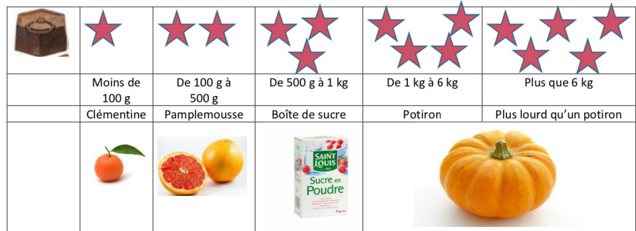
Figure 6. Fiche règle du jeu « Défis nature de petits » (gauche) et extrait de la fiche de préparation du professeur

Il est tout à fait possible de jouer à ce jeu en loisirs ou en famille sans avoir connaissance de la signification utilisée pour attribuer le nombre d'étoiles aux grandeurs. Mais, afin d'exploiter ce jeu en atelier de mathématiques en classe, la professeure a choisi de réaliser un travail conséquent de compréhension des critères. Lors de la première séance et afin de travailler sur l'estimation des masses, les objets et végétaux suivants ont été sous-pesés en classe : clémentine, pamplemousse, 1 kg de sucre, un potiron (Figure 6, extrait de la fiche de préparation du professeur). La dévolution de la tâche aux élèves s'est faite avec une contextualisation en lien avec des végétaux de saison (l'automne) connus des élèves.