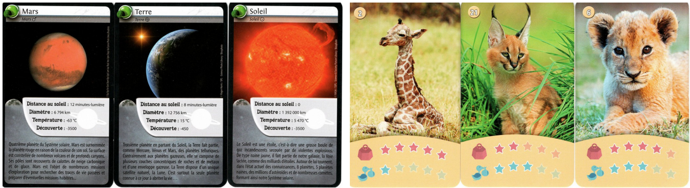
Figure 4. Exemples de cartes non auto-correctives « Défis nature Espace » (gauche) et « Défis nature des petits Savane » (droite)