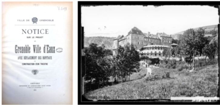
« Grenoble Ville d'Eaux ». Projet d'adduction des eaux de source chaude de La Motte les Eaux (aujourd'hui La Motte Saint Martin) jusqu'à Grenoble.

En s'appuyant sur des recherches récentes ou en cours, auxquelles nous contribuons tant côté AAU que côté PACTE, nous interrogerons plus particulièrement trois situations qui nous semblent riches pour tenter de révéler ces écologies : Grenoble ville d'eaux (projet non réalisé, XIXe), Grenoble Bastille (site emblématique XXe et XXIe), Grenoble Presqu'île (nouveau quartier, XXIe).