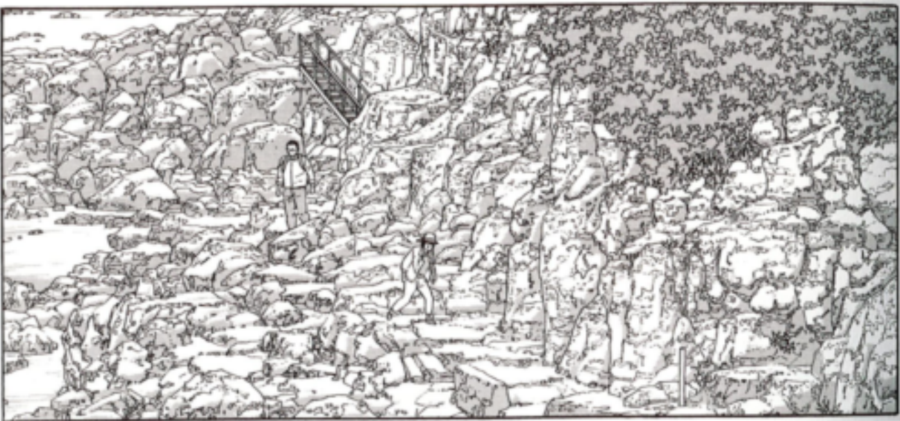
© PAPIER/Jirô TANIGUCHI par l'intermédiaire du BCF-Tokyo