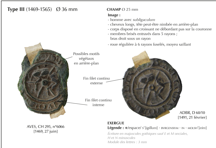
Fig. 2 : Sceau des bourgeois de Molsheim, type III.

La différence la plus manifeste concerne la position du personnage. Visiblement mal à l'aise avec le format du sceau (il fallait faire tenir l'image dans un disque de 25 mm de diamètre), le graveur du milieu du XIV e siècle a fait déborder le corps de saint Georges sur la couronne de la roue, tandis que l'orfèvre du XV e siècle a parfaitement su le faire tenir dans l'instrument du supplice. Au niveau vestimentaire, le long perizonium introduit vers 1369 pour cacher la nudité du saint patron des bourgeois de Molsheim qu'on trouvait sur le type I s'est mué en un subligaculum qui renoue peut-être mieux avec l'image initiale d'athlète du Christ. Malheureusement aucune empreinte de notre corpus actuel ne nous permet d'avoir une idée précise de son visage sur aucun des deux sceaux, mais il semblerait qu'il soit demeuré imberbe. Si la présence d'un nimbe est clairement marquée sur le type II, elle est bien plus discrète sur le type III, où un disque très fin se devine en arrière-plan. Les cheveux du martyr paraissent plus longs en 1469 que cent ans auparavant. En revanche, avec ses six rayons fuselés et son moyeu saillant, la roue est identique sur les deux types. De même, le corps meurtri est toujours