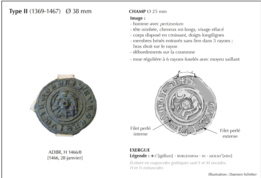
Fig. 1 : Sceau des bourgeois de Molsheim, type II.

Le premier résultat de cette vaste entreprise ne s'est pas fait attendre. C'est en effet au cours du travail d'alimentation de la base de données qu'il nous est apparu que ce que nous avons identifié naguère comme le « type II » en usage entre 1369 et 1565 recouvrait en fait deux sceaux consécutifs. La présente contribution entend par conséquent rectifier et compléter la typologie sigillaire de la ville en y intégrant ce nouveau « type III » qui nous avait échappé.