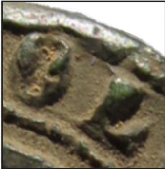
AVES, CH 150, n° 3078 [1407, 6 mai]