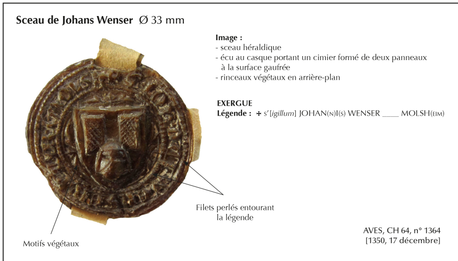
Fig. 4 : Sceau du maître-receveur de l'hôpital (1350).

disposé en croissant et ses membres sont entravés dans cinq rayons, à cette différence près que le bras droit passe devant le rayon sur le type II, mais derrière sur le type III.