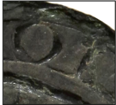
AM Mutzig, JJ 15 [1565, 29 janvier]