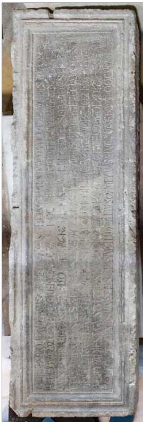
Fig. 19 – Carpentras, Musée bibliothèque, épitaphe de l'évêque Geoffroi (début du XIII e siècle). cl. Jean-Pierre Gobillot.