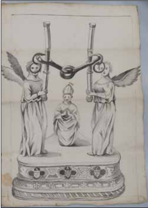
Fig. 17 – Carpentras, Bibl. Inguimbertaine, ms 1682, f. 123 (xviii e siècle).