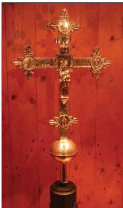
Fig. 9 – Venasque, église, croix de procession argentée, 1498.