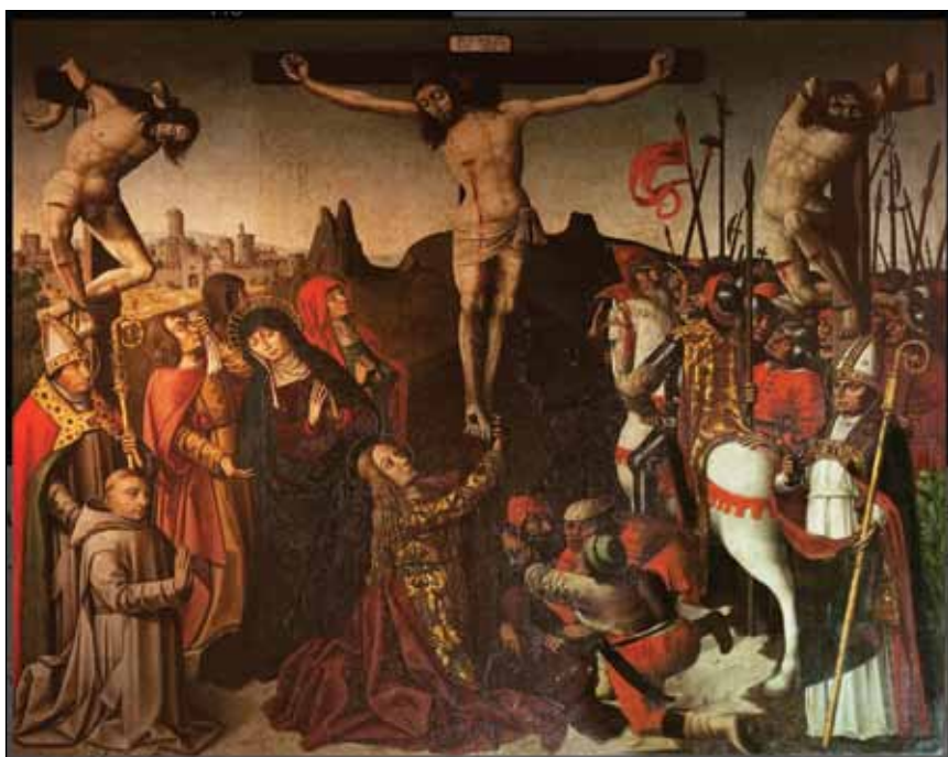
Fig. 8 – Venasque, église, Crucifixion , retable, c. 1498.