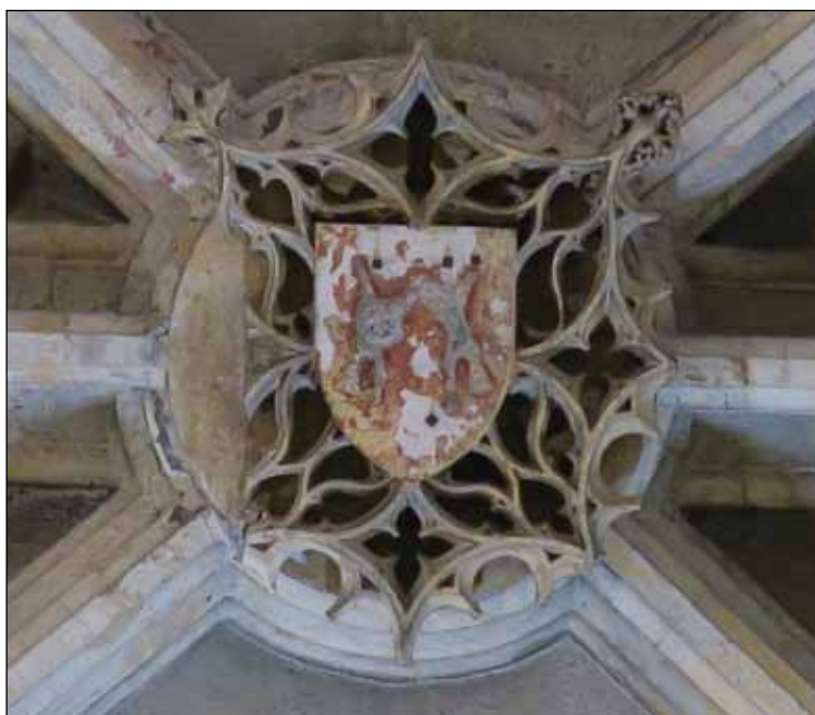
Fig. 15 – Carpentras, cathédrale, clef de voûte des cinquième et sixième travées (c. 1450-1480).