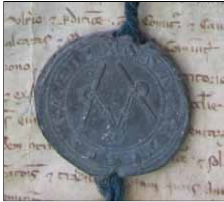
Fig. 11 – Sceau de l'évêque Isnard, Carpentras, Bibl. Inguimbertaine, ms 561, n° 246, revers (octobre 1226).