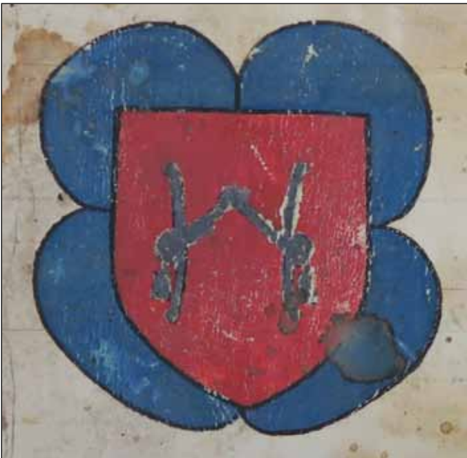
Fig. 18 – Carpentras, Bibl. Inguimbertaine, ms 83, page de garde verso (1440).