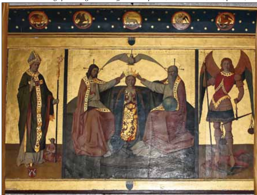
Fig. 3 – Carpentras, cathédrale, Enguerrand Quarton, Couronnement de la Vierge , triptyque, c. 1460.