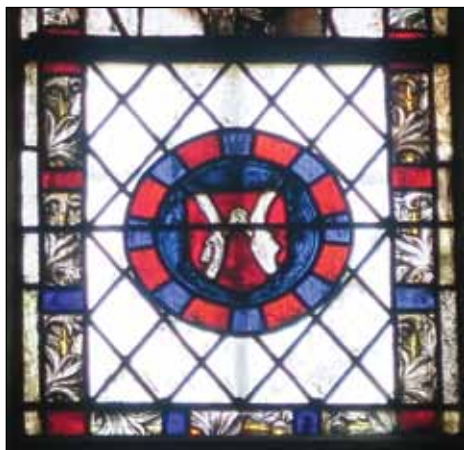
Fig. 4 – Carpentras, cathédrale, chapelle de l'Annonciation, baie de droite.