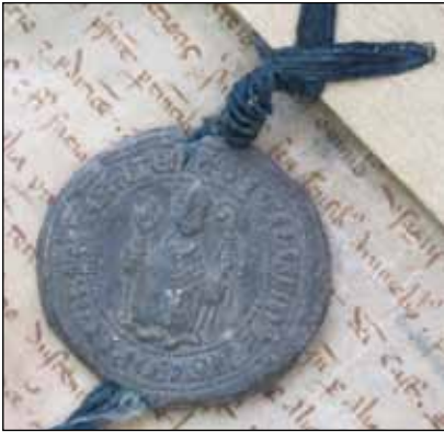
Fig. 10 – Sceau de l'évêque Isnard, Carpentras, Bibl. Inguimbertaine, ms 561, n° 246, avers (octobre 1226).