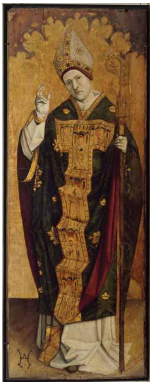
Fig. 7 – Avignon, Musée du Petit Palais, panneau d'un retable de l'église de Mazan, c. 1475. cl. Ville d'Avignon.