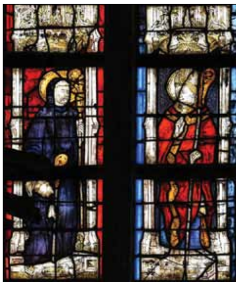
Fig. 6 – Carpentras, cathédrale, baie de l'abside sud, détail.