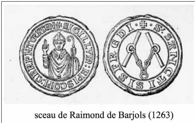
Fig. 12 – Sceau de l'évêque Raymond de Barjols, 1263 ? (Louis BLANCARD, Iconographie des sceaux et bulles conservées dans la partie antérieure à 1790 dans les Archives départementales des Bouches-du-Rhône , Marseille-Paris, 1860, p. 180 et pl. 79, n° 3, sceau séparé de son acte).