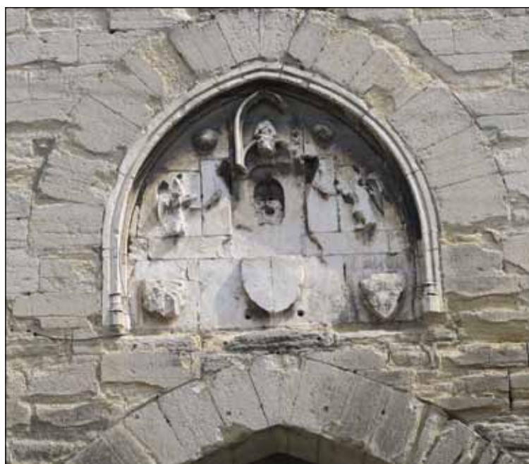
Fig. 16 – Carpentras, porte d'Orange (nord), emblèmes, dernier tiers du XIV e siècle.