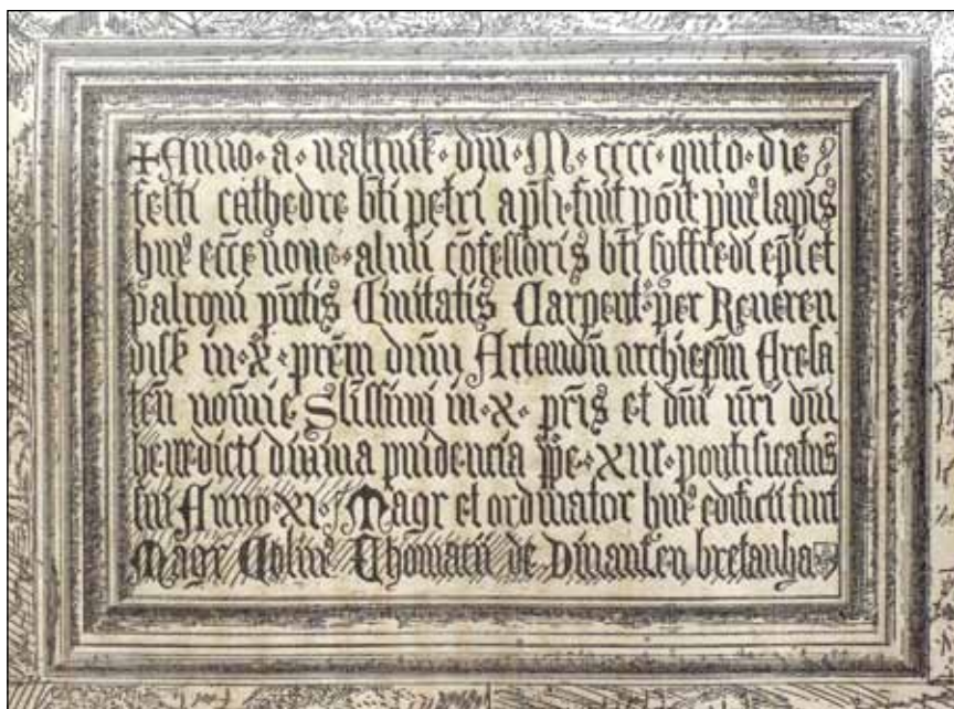
Fig. 2 – Carpentras, inscription d'inauguration du chantier de la cathédrale (E. ANDRÉOLI, B.-S. LAMBERT, Monographie de l'église Saint-Siffrein de Carpentras , Paris-Marseille, 1862, pl. h. c.).