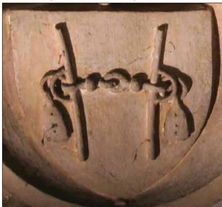
Fig. 14 – Carpentras, cathédrale, claf de voute de l'oratoire du saint mors (c. 1406-1440).