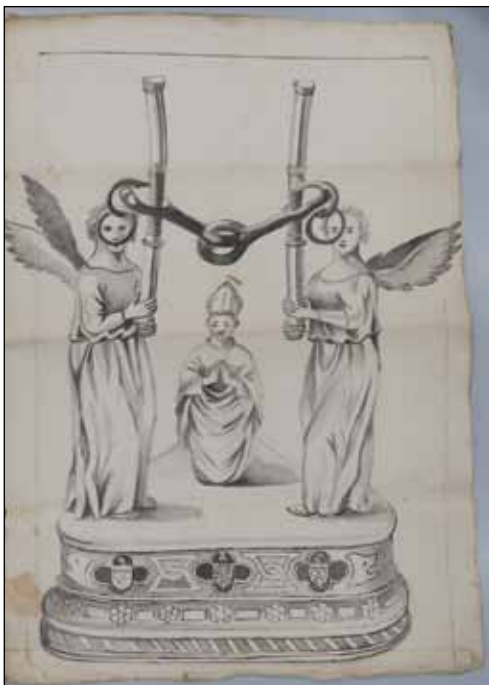
Fig. 17 – Carpentras, Bibl. Inguimbertaine, ms 1682, f. 123 (xviii e siècle).