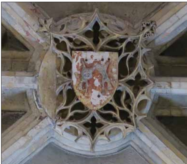
Fig. 15 – Carpentras, cathédrale, clef de voûte des cinquième et sixième travées (c. 1450-1480).