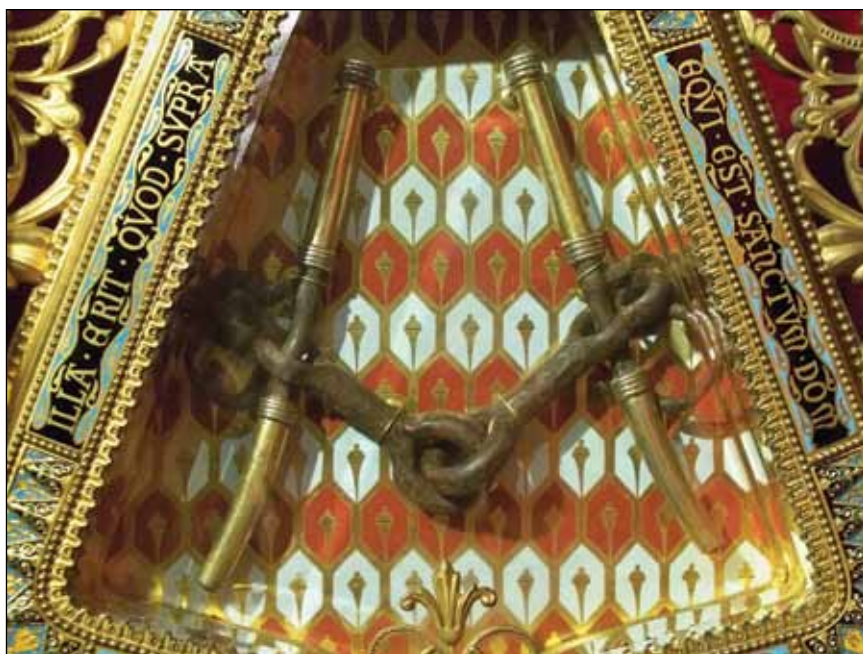
Fig. 13 – Carpentras, cathédrale, oratoire du saint mors, relique du saint mors dans son reliquaire du XIX e siècle.