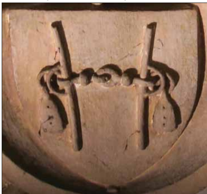
Fig. 14 – Carpentras, cathédrale, clef de voûte de l'oratoire du saint mors (c. 1406-1440).