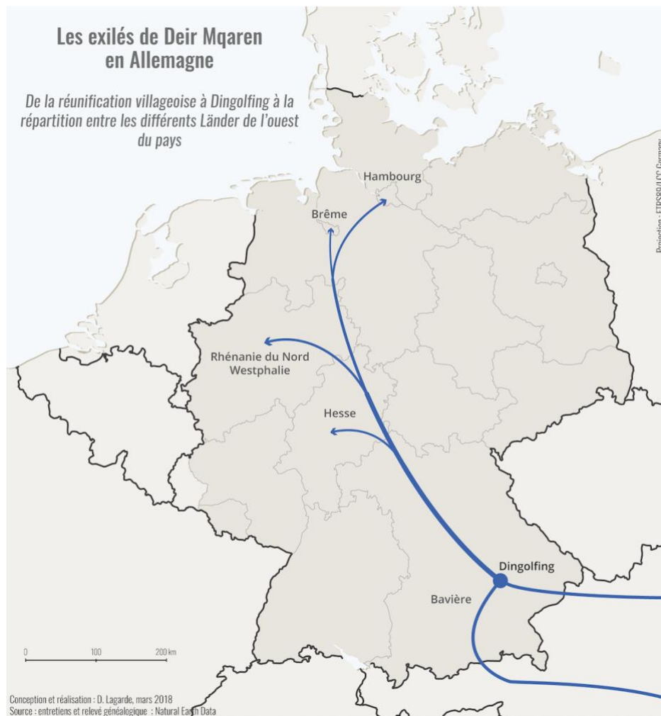
Figure n° 3 :