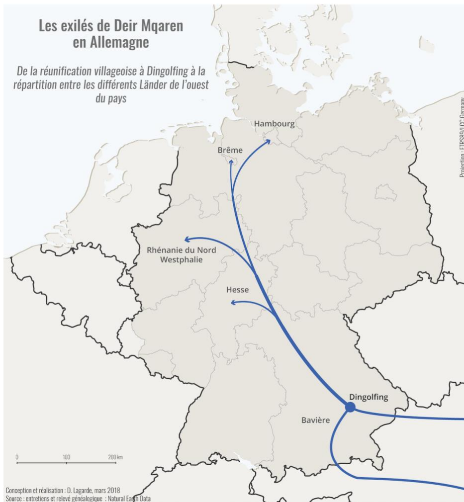
Figure n° 3 :