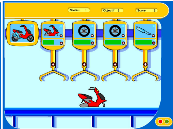
Figure 4 : Jeu d'adresse « Technocity »