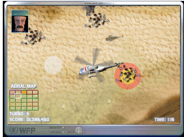
Figure 9: Jeu Food force – exemple de jeu