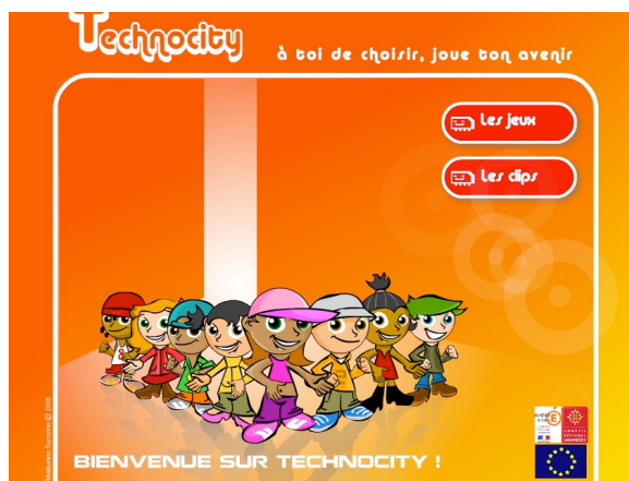
Figure 1 : Interface Technocity