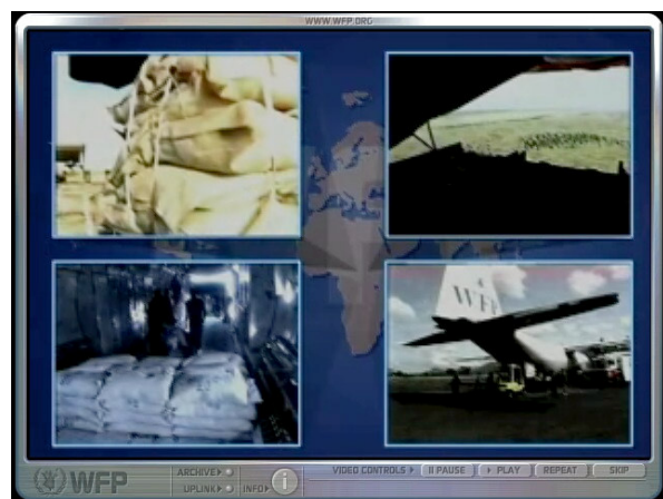
Figure 7 : Jeu Food force – séquences vidéo