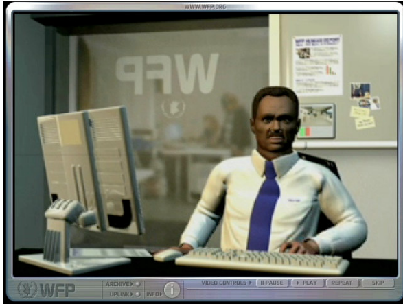
Figure 8: Jeu Food force – Introduction d'un jeu