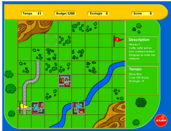
Figure 5 : Jeu de simulation dédié au