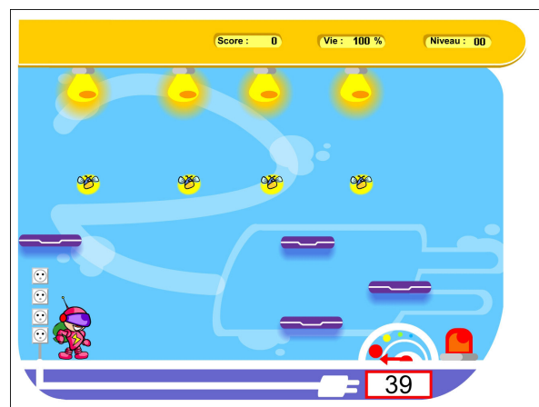
Figure 2 : Jeu de plateforme « Technocity »