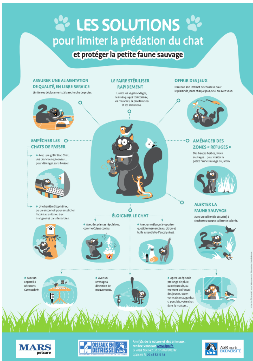
Figure 4, une affiche incitant à limiter la prédation de la petite faune sauvage par les chats domestiques, LPO 2020

- Réduction de la prédation dans les espaces naturels. La prédation des chats y est considérée comme dommageable lorsqu'il s'attaque à des espèces natives, et dramatique si ces espèces sont protégées ou en danger d'extinction. Dans ce cas, les gestionnaires de la nature et les biologistes de la conservation considèrent qu'ils ont l'obligation légale et morale de tout faire pour éliminer la prédation par les chats. Pour les chats harets, la stérilisation et le retour dans la nature n'est pas une option envisagée, car le relâchage d'un chat, même stérilisé, dans un milieu où il ne peut se nourrir que par la chasse, entrainerait un niveau de prélèvement considérée comme incompatible avec la préservation de la faune native. L'objectif retenu est donc un retrait des chats définitif. Il ne peut cependant se faire qu'en respectant la législation qui interdit toute forme de maltraitance. Il est donc nécessaire de capturer les chats par un piège non léthal, puis de l'amener dans un refuge, où il est proposé à l'adoption durant au moins 8 jours (3 en