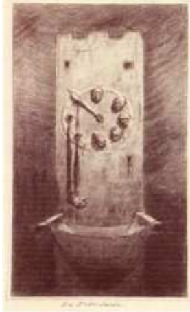
L'heure de la mort (1900)

Fuir la mort ; la repousser toujours et recréer de nouveaux mondes de rêves, c'est en jouir toujours. Accumuler les cadavres et les corps en décomposition tel encore l'obsessionnel collectionnant les femmes parce qu'il sait que La Femme est impossible comme la Mort est impossible. Il lui faut pour cela contrôler le temps – la tour de l'horloge est le centre de Perle – et se faire le maître du temps et ainsi le maître de la mort.