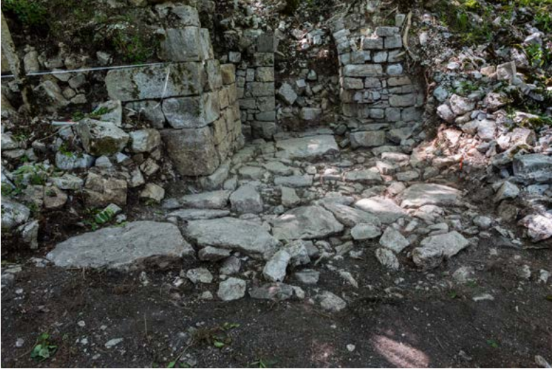
Figure 4. Vue des vestiges du second sondage dans l'axe de la nef

On peut noter que si l'interprétation de ce corpus ne laisse que peu de doute, nous ne sommes pas encore en capacité de