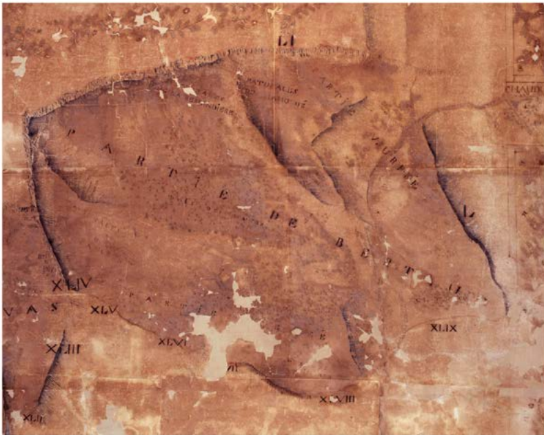
Figure 1. Plan géométral du domaine de Durbon en 1747, avec focale sur le désert de Bertaud Archives départementales des Hautes-Alpes 1 H 225.