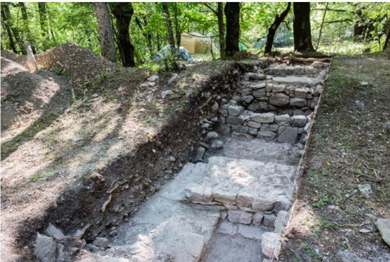
Figure 5. Vue générale du troisième sondage ouvert dans la terrasse intermédiaire – cliché F. Giraud, 2017