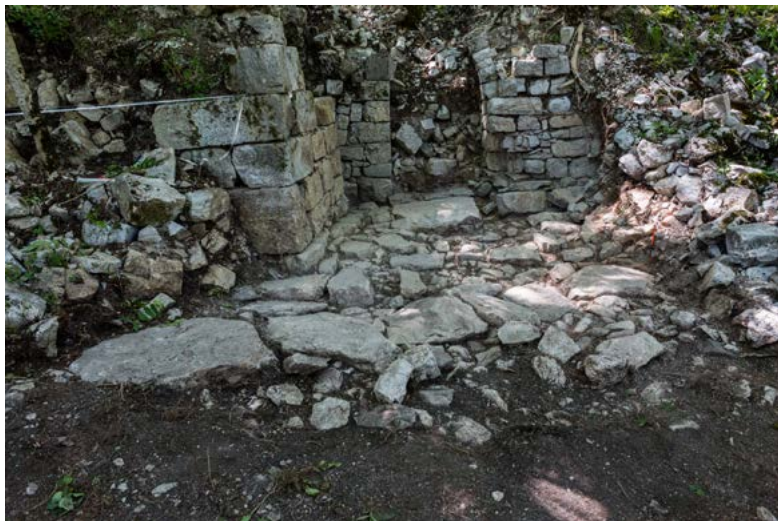
Figure 4. Vue des vestiges du second sondage dans l'axe de la nef – cliché F. Giraud, 2017

On peut noter que si l'interprétation de ce corpus ne laisse que peu de doute, nous ne sommes pas encore en capacité de