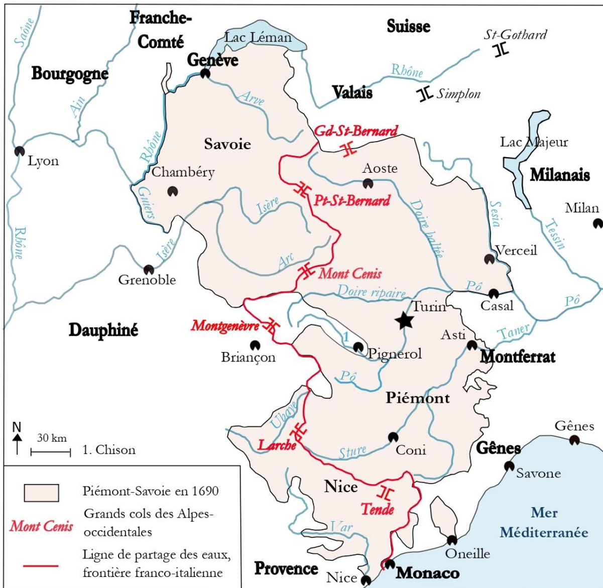
Carte 2 – Le Piémont-Savoie, « portier » des Alpes occidentales