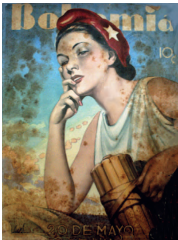
Bohemia . 18 de mayo de 1947. Biblioteca Nacional José Martí, La Habana, Cuba.

Un poco antes de finalizar la década, en 1947, asoma una figura exclusiva que conjuga, por primera vez en la lámina alegórica, dos técnicas: la fotografía y el dibujo. El diseño libre se fusiona con la instantánea fotográfica y se obtiene una imagen que está más cercana a los cánones estilísticos de la década posterior. Esta alegoría insiste en el uso de vestimentas clásicas, el gorro frigio y el haz de varillas proveniente del escudo. Con esta portada cierra el ciclo de alegorías de Bohemia , quien en la década del 50' se inclina por diferentes tipos de metáforas republicanas. La comprensión de la fecha se ofrece desde otras perspectivas y la personificación femenina del Estado se disipa y otros recursos simbólicos son utilizados en cambio. La bandera ondeando en el Morro, fotografías de desfiles militares, recuerdos gráficos del primer 20 de mayo, las luchas mambisas...son algunos de los motivos que reemplazan a la alegoría de su papel representacional.