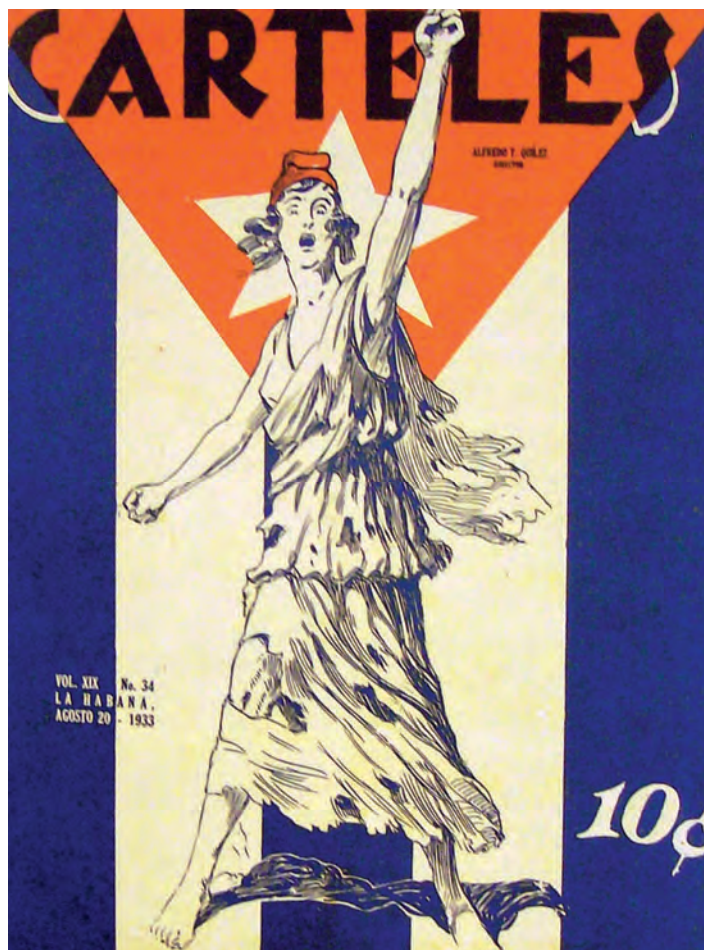
Carteles . 20 de agosto de 1933. Biblioteca Nacional José Martí, La Habana, Cuba.

En agosto de 1933, por el contrario, la República pierde su jovialidad. Tras el derrocamiento de Machado, la nación se representa en harapos, arruinada, pero con el puño levantado. La fuerza del impacto visual radica en la simplicidad de sus elementos. El fondo de la bandera, el desgarramiento de las vestiduras de la República que renace, que cierra con fuerza su puño y lo alza, aluden a la resurrección y a la oportunidad de reconstruir lo perdido, una vez vencido el tirano. Esta portada concuerda con el ánimo general de la época, puesto que se relaciona con las portadas alegóricas de Bohemia de este año, enfocadas también en representar el fin del Machadato y la necesidad de un nuevo comienzo.