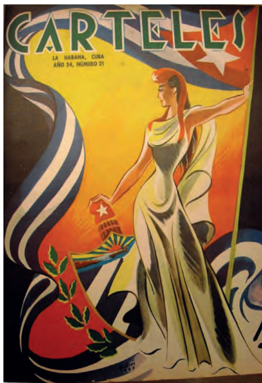
Carteles . 21 de mayo de 1953.

No obstante, por el cincuentenario de la República, la dicha vuelve esperanzada, en celebración de medio siglo de vida republicana. En 1952 se edita un número especial que presenta un exterior singular por los recursos alegóricos que utiliza. El escudo nacional, ubicado al centro, está custodiado por dos damas; una de ellas vestida a la usanza de los primeros tiempos republicanos y la de la derecha según la moda elegante y moderna de los años 50'. Entre ambas sostienen una banda con el lapsus conmemorativo (1902-1952 y en el medio, frente al escudo, la palabra Cincuentenario ). La bandera delinea, a modo de cortina, los límites de la escena. En esta fachada conmemorativa el escudo es el núcleo de la obra, mientras que las jóvenes se ubican para encarnar las épocas del pasado y el presente de la República. Una, el inicio fundacional de 1902 y la otra el instante del cincuentenario. La alegoría republicana se diluye y se bifurca en metáforas de los períodos que marcan el comienzo y el fin del aniversario; se descarta el empleo de los atributos tradicionales de la alegoría y se recurre a la caracterización mediante los atuendos, peinados y cortes de cabello. La figura femenina continúa asociada a la personificación republicana, pero sin el protagonismo del que había gozado hasta el momento.