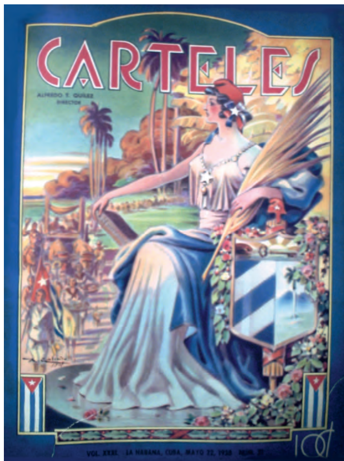
Carteles . 22 de mayo de 1938. Biblioteca Nacional José Martí, La Habana, Cuba.

La portada de 1938 constituye la más barroca y pródiga en material simbólico. Galindo, el ilustrador, nos entrega una alegoría nacional en extremo poetizada y sublimada. La República con túnica romana, entronizada, sujeta con su mano derecha un libro con el título de Historia y con la otra una espiga de trigo. La estrella solitaria cierra el vestido en su pecho y se repite el motivo en el gorro frigio que ostenta sobre su cabeza. El escudo adornado con guirnaldas de flores se encuentra al frente, próximo al borde derecho. Una multitud, liderados por un abanderado con el estandarte nacional, avanza hacia ella con ofrendas. Tal escena se desarrolla en un paraje tropical, de palmas y playas. Esta imagen reitera los símbolos ya tradicionales de la alegoría: los ropajes clásicos, el escudo, el gorro frigio, la estrella solitaria, la bandera, la