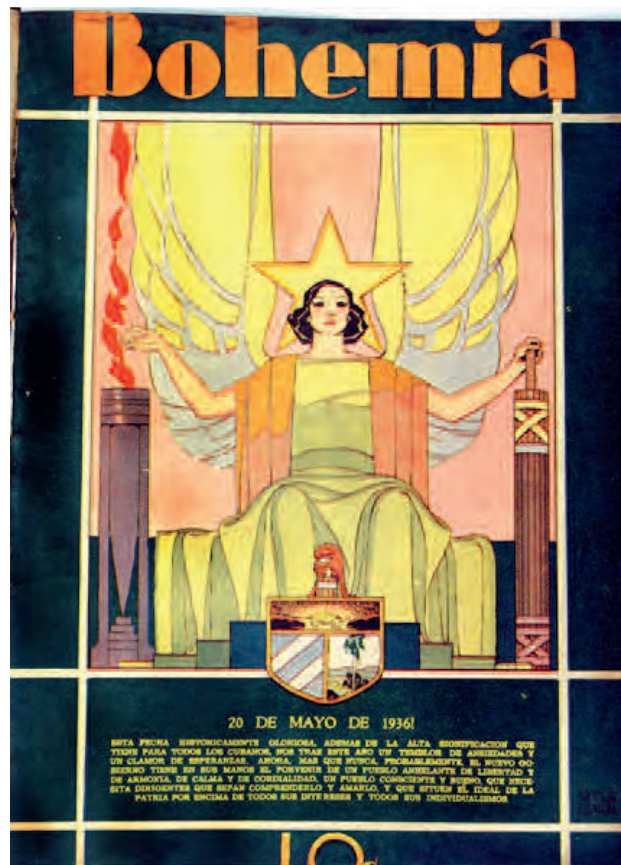
Bohemia . 24 de mayo de 1936. Biblioteca Nacional José Martí, La Habana, Cuba.

En 1935 la imagen sosegada e ideal retorna a las páginas de Bohemia . La nación se personifica bajo los rasgos de una grácil joven, ingenua, delicada, vestida con los colores de la bandera, gorro frigio y con un ramo de flores (rojas y azules) en sus brazos, mientras recorre apaciblemente un entorno idílico de nubes. Todo el diseño del anverso se realiza utilizando los colores de la insignia nacional, incluido el marco exterior del cabezal de la revista. La paz ennoblecida se reintegra al carácter de las alegorías.