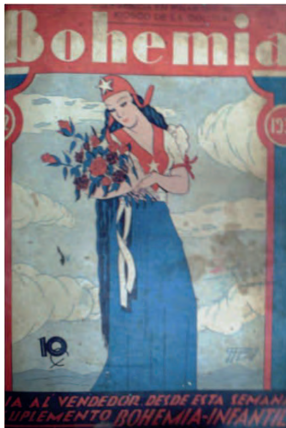
Bohemia . 19 de mayo de 1935. Biblioteca Nacional José Martí, La Habana, Cuba.

En estos dos últimos iconos no existen atisbos de sensualidad o majestuosidad sobria, sino que la rigidez, lo marcado de las líneas y la severidad integran los caracteres predominantes. Bohemia en estos años se introduce en el campo de lo político y por ello sus portadas se vuelven plataformas de la agitación social que sacudía al país. La República se convierte en una guerrera que abandona su pedestal y se embarca en la misión de restablecer el orden constitucional.