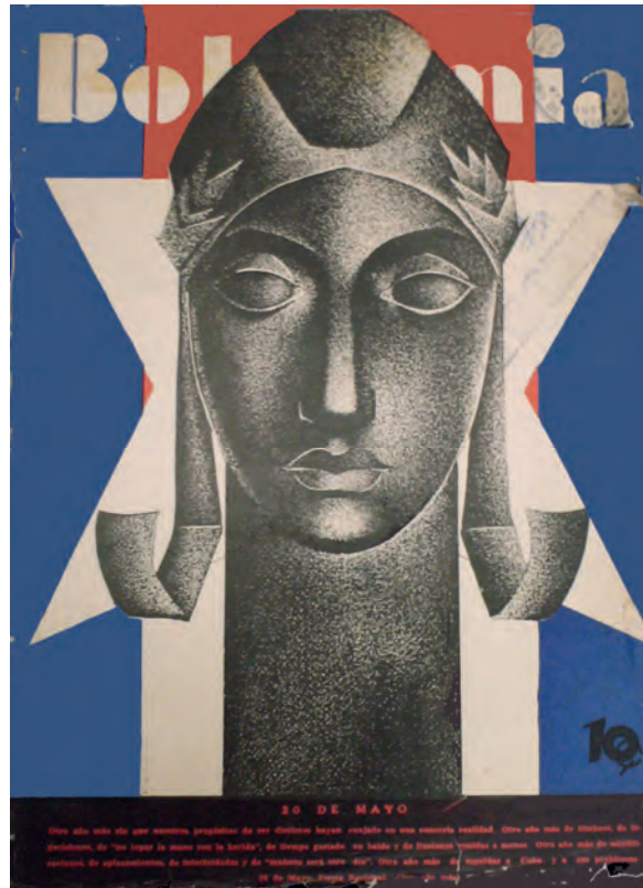
Bohemia . 21 de mayo de 1940. Biblioteca Nacional José Martí, La Habana, Cuba.

curso político del país, que había demostrado no cumplir con el proyecto de los revolucionarios de la década de 1930.