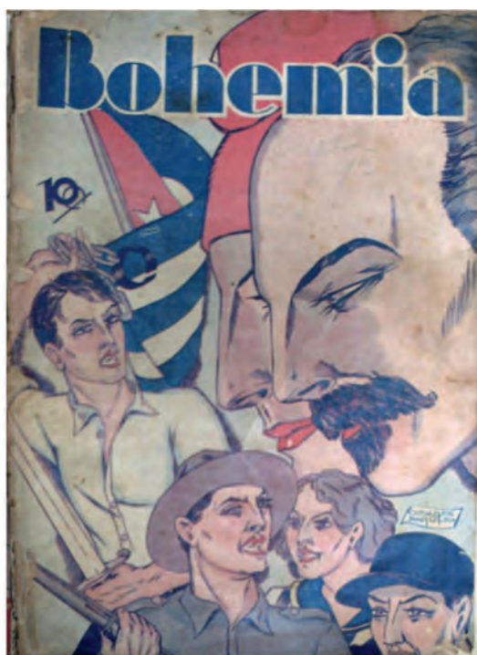
Bohemia . 1 de octubre de 1933. Biblioteca Nacional José Martí, La Habana, Cuba.

En los años subsiguientes sobreviene la etapa más amarga y cruenta del gobierno de Gerardo Machado, dictador que asume el poder en 1925. La alegoría se ausenta y solo renace con el derrocamiento definitivo del presidente. Por las particularidades del contexto político de esta época, con el establecimiento de la dictadura de Machado, la fecha del 20 de mayo pierde su valor como día de gloria para la República y este sentido se traslada a las fechas iniciales de las gestas independentistas. Por esto, se analizan portadas alegóricas que no surgen con motivo de la data fundacional, pero sí con la misma significación, lo que desplazadas en el calendario.