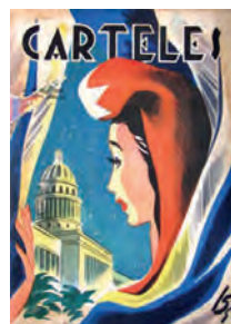
Carteles . 20 de mayo de 1951.

En 1944 se exhibe una República que mira con recelo y desconfianza las propagandas políticas. La corrupción y la politiquería la hacen sospechar y dudar de aquellos que se publicitan como los portavoces de sus intereses. Abajo, el sello con la máxima martiana: La patria es ara, no pedestal . Igualmente, en 1946 una República abatida hace caso omiso de los festejos y fuegos artificiales que en su honor se lanzan cercanos al Capitolio Nacional, mientras