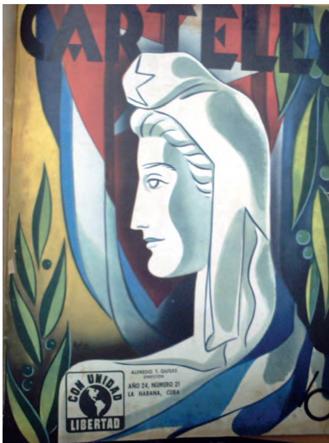
Carteles . 21 de mayo de 1943. Biblioteca Nacional José Martí, La Habana, Cuba.

espiga de trigo, el paisaje tropical como sinécdoque de la Isla, el libro de Historia como metáfora del paso del tiempo, entre otros. Lo realmente excepcional de esta ilustración resulta la prodigalidad iconográfica y la actitud majestuosa de la alegoría sedente. Véanse las portadas de Bohemia de 1928 y 1936, donde también aparece la República entronizada. Las líneas curvas y gráciles ceden, pues, en la década del 30' frente a la solemnidad y majestuosidad del espíritu de la época, inspirado en las formas duras del Art Decó y en los perfiles angulosos provenientes de la escultura y de los edificios públicos.