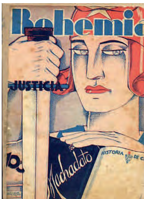
Bohemia . 5 de noviembre de 1933. Biblioteca Nacional José Martí, La Habana, Cuba.

El rostro de la República con gorro frigio aparece de perfil, apenas visible, detrás del semblante del Apóstol, también de perfil, quien ocupa el primer plano; más abajo, un grupo de cubanos armados y dispuestos a la lucha y uno de ellos con unas cadenas rotas en sus manos, con actitud de liderazgo. Al fondo, la bandera del triángulo rojo ondea. En esta imagen, Oscar Salas, su ilustrador, fusiona varios mitos del imaginario independentista y patriótico: la figura de José Martí, el alzamiento de la Demajagua 17 , la bandera nacional y, por último, la alegoría republicana. El ideario martiano, el ímpetu insurreccional ante un sistema opresor, las ansias de libertad y el patriotismo a ultranza se conjugan como conceptos que aúnan a la nacionalidad cubana y su proyecto de independencia.