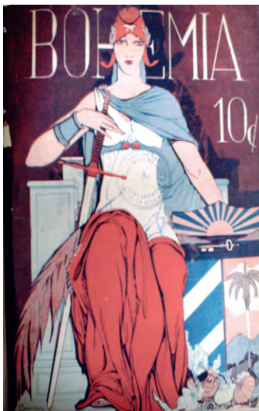
Bohemia . 20 de mayo de 1928. Biblioteca Nacional José Martí, La Habana, Cuba.

En la portada de 1928, en cambio, la composición se complejiza y se carga de atributos simbólicos. En estos años las portadas comienzan a jugar con la visualidad escultórica, y arquitectónica que, según veremos en las publicaciones de 1936 y 1940, será una relación más directa y evidente en los años sucesivos. Los códigos del Art Decó, que para entonces comienza a dominar la creación arquitectónica cubana, se trasladan a las figuras alegóricas a partir de una mayor majestuosidad, sentido volumétrico y sobriedad de las líneas. La sensualidad se sustituye por lo mayestático. La República, sedente, vestida a la usanza romana pero con los colores de la bandera, se apoya sobre una espada con su mano derecha y con la izquierda sostiene el escudo nacional. Una espiga de trigo (símbolo de agricultura) reposa en sus piernas y flores, caracoles...descansan a los pies del escudo. Sobre su cabeza, el gorro frigio con la estrella solitaria y una corona de laurel. Los elementos se organizan siguiendo las pautas de un esquema sobrio y rígido; la pose de la figura, la grandilocuencia de sus atributos y hasta la tipografía de la publicación denotan solemnidad y fastuosidad.