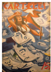
Carteles . 21 de mayo de 1950. Biblioteca Nacional José Martí, La Habana, Cuba.