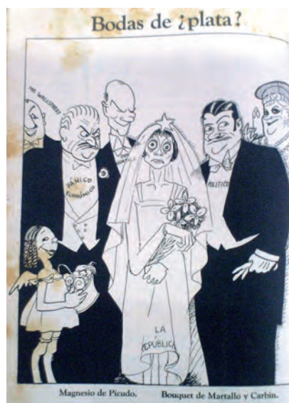
Carteles . Caricatura al anverso de la portada. 22 de mayo de 1927. Biblioteca Nacional José Martí, La Habana, Cuba.

Sin embargo, al interior de la revista de Carteles se narraba algo bien diferente. La caricatura ¿Bodas de plata? descubre una República cadavérica, aterrorizada y angustiada, vestida de novia, que es asediada por lascivos pretendientes (Pánico Económico, Mr. Wallstreet, Don Guataca) y escudriñada por viejas chismosas (Doña Lotería). ¿Dónde ha quedado la felicidad del aniversario? En la superficie. Al interior se muestra el verdadero estado de la República, asediada por continuos males y oportunistas.