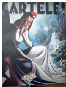
Carteles . 19 de mayo de 1946.