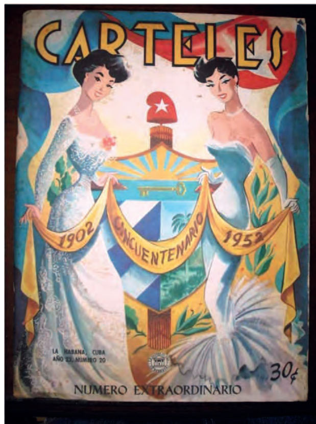
Carteles . 18 de mayo de 1952. Biblioteca Nacional José Martí, La Habana, Cuba.

En todas estas portadas, el tipo alegórico es similar (marcado por la mano del ilustrador que siempre es el mismo, Andrés García Benítez): una joven con gorro frigio, morena, de curvas sensuales, labios rojos y ojos almendrados. La bandera aparece ocasionalmente, en los márgenes como telones o sostenida en el asta. Los atributos iconográficos se han reducido sustancialmente y la mujer, el gorro frigio y la bandera restan como los únicos distintivos. La tristeza, la desconfianza, el desengaño y la sospecha definen estas representaciones, puesto que la alegoría observa con desdicha los manejos turbios y oportunistas que en el campo de la política se realizaban en su nombre.