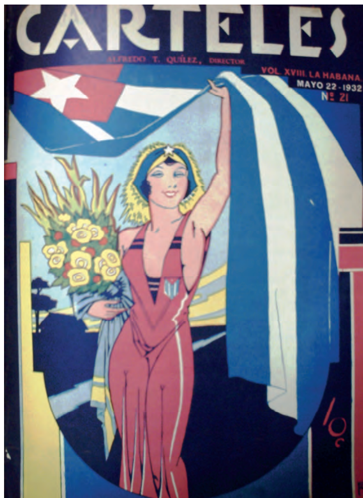
Carteles . 22 de mayo de 1932. Biblioteca Nacional José Martí, La Habana, Cuba.

En la década del 30' Carteles renueva su formato, desecha las fotografías y empieza a decorar sus frontales con ilustraciones. En 1932 emerge la primera alegoría en colores, con un carácter festivo y laudatorio. La República, con evidente entusiasmo, descubre su figura al correr la bandera con uno de sus brazos, mientras con el otro sostiene un ramo de flores. Un ceñido vestido rojo – con un sello de la bandera – destaca sus curvas y sobre su cabeza una banda azul rematada con la estrella solitaria y fulgores dorados acentúa su belleza.