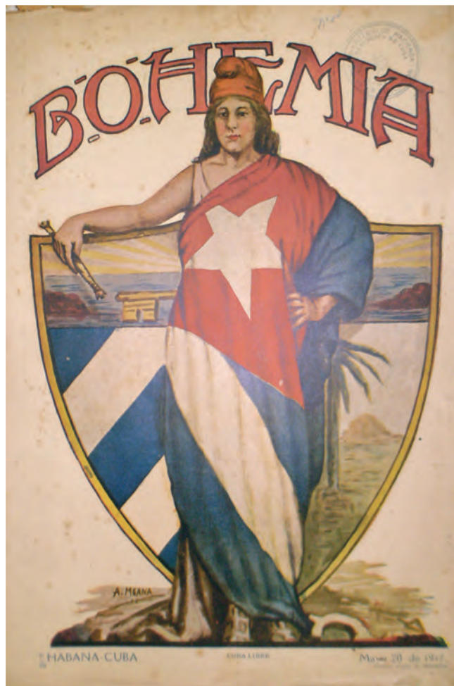
Bohemia . 20 de mayo de 1917. Biblioteca Nacional José Martí, La Habana, Cuba.

cadena de flores. A sus pies, el escudo nacional y un campesino que ara el suelo. La Libertad de Delacroix se ha invertido, el fusil ha sido sustituido por el ramo de flores y el chico de las pistolas por el agricultor, pero la estructura compositiva es la misma. El ímpetu pujante de la Revolución Francesa ha sido reemplazado por el alivio dulcificado de un sistema instituido, lo cual le resta la rebeldía y la impetuosidad de la Liberté . Una imagen sosegada, clásica y serena se erige aquí como el símbolo de nuestra República, frente al pueblo humilde y trabajador que figura el jovenzuelo. En el centro, un poema titulado Patria ensalza la nación cubana.