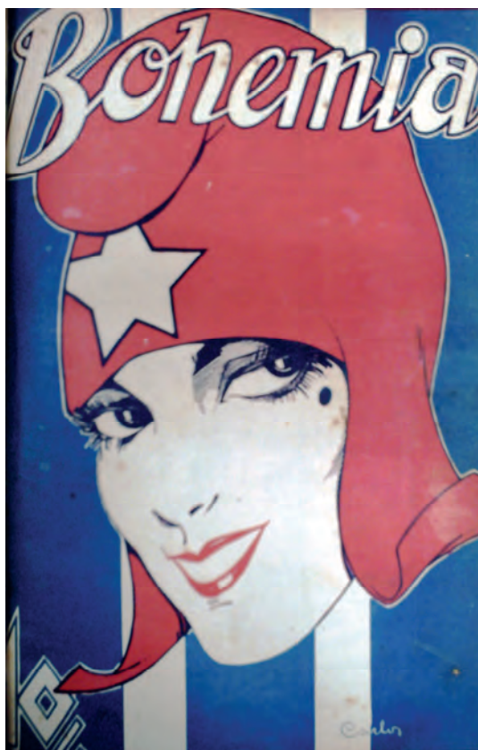
Bohemia . 2 de mayo de 1927. Biblioteca Nacional José Martí, La Habana, Cuba.

en su mano lo que parece ser un cetro, se apoya en el escudo patrio de escala humana, coronada por un gorro frigio. La dama alegórica es la protagonista y se prescinde de cualquier otro elemento, escena o ambiente que vaya más allá de la iconografía que devendrá característica: el escudo, la bandera y el gorro frigio. Por ello, esta ilustración de A. Meana resulta un patrón ejemplar de la alegoría cubana.