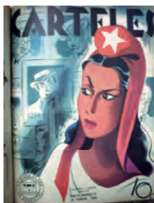
Carteles . 21 de mayo de 1944. Biblioteca Nacional José Martí, La Habana, Cuba.

Más allá de las transformaciones estéticas, ocurrieron también en esta etapa cambios en la esfera ideológica, que modificaron a la alegoría no en su iconografía, pero sí en su actitud. El fracaso del mito republicano, los fraudes electorales, las dictaduras y los golpes de Estado generaron un creciente descontento y pesimismo que se reflejaron en las encarnaciones de la República. La alegoría se acriolla, se aleja del clasicismo grecorromano y se humaniza. En tiempo de elecciones se muestra doliente, presa de la incertidumbre; la representación se vuelve dramática, casi patética en su angustia. Se alude a la demagogia y al oportunismo político.