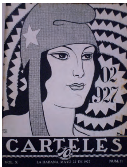
Carteles . 22 de mayo de 1927. Biblioteca Nacional José Martí, La Habana, Cuba.

y el empleo del blanco y el negro le otorgan una visualidad única y característica a esta silueta. Esta imagen difiere y se relaciona a un mismo tiempo con la portada de Bohemia de igual fecha. Ambas sintetizan la efigie alegórica en el rostro y portan gorro frigio como icono distintivo, pero el espíritu de una y otra es totalmente diferente. La de Carteles se caracteriza por la gravedad con que se asume la celebración mientras que la de Bohemia prefiere el estilo diáfano del canon publicitario. Las dos presentan una república radiante, pero con métodos distintos.