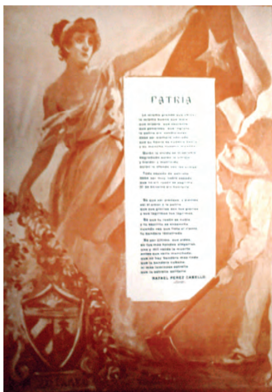
Bohemia . 25 de mayo de 1913. Biblioteca Nacional José Martí, La Habana, Cuba.

En las ediciones próximas al 20 de mayo la revista emitía números con cubiertas especiales que mostraban efigies alegóricas del país. Su larga vida editorial (desde 1910 hasta la actualidad) permite apreciar cómo se desarrolló el fenómeno alegórico durante todo el período republicano.