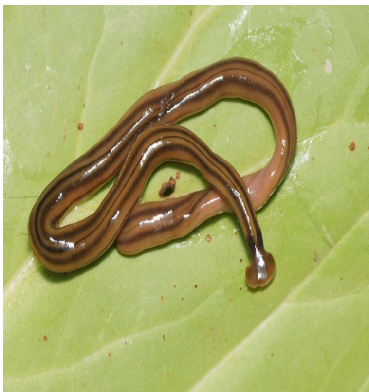
Une des espèces de grande taille de ver plat à tête en forme de marteau présente en France, Bipalium kewense par Pierre Gros

Pourquoi doit-on s'inquiéter de la présence de vers plats exotiques ? Ces espèces pourraient-elles simplement représenter une nouvelle faune, caractéristique des jardins du XXI e siècle ? Après tout, la biodiversité est dynamique ; on sait que les espèces se déplacent au gré des bouleversements climatiques ou géologiques, et de la dispersion naturelle des individus. Toutefois, comme c'est souvent le cas des espèces transportées par l'homme, on a de bonnes raisons de craindre que leur introduction puisse bouleverser les écosystèmes envahis. Dans le cas de ces vers plats, leur régime alimentaire est en cause : ils sont prédateurs de gastéropodes (escargots, limaces) ou de vers de terre, architectes essentiels des sols. D'autres espèces semblables ont déjà provoqué des dégâts : en Angleterre, le ver plat Arthurdendyus triangulatus , originaire de Nouvelle-Zélande, entraîne le déclin des populations de certains vers de terre dont il se nourrit.