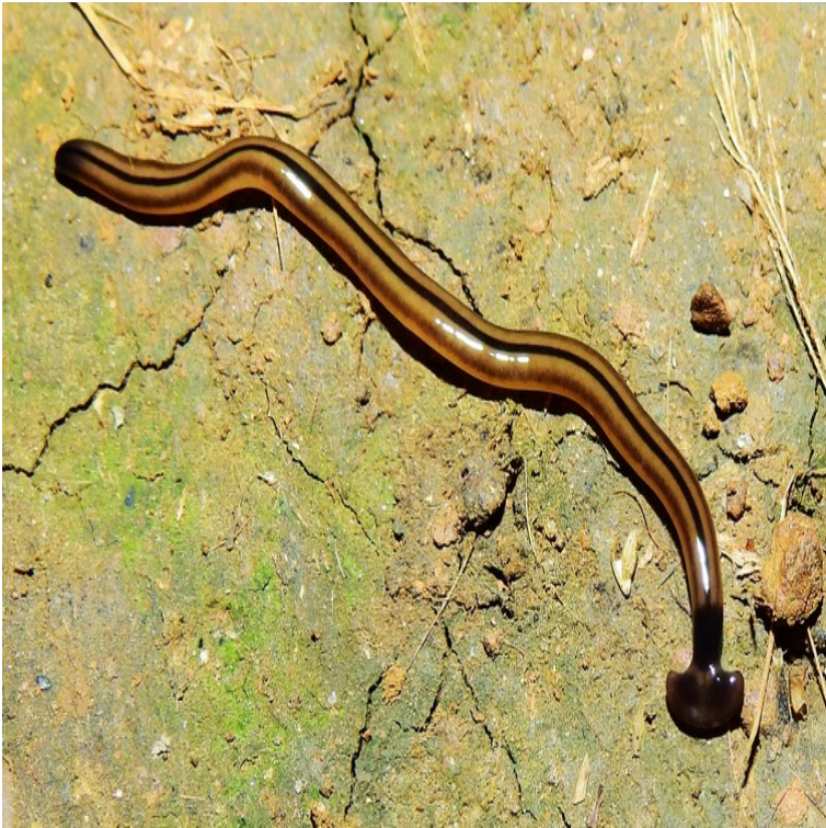
Bipalium vagum , une espèce qui n'a pas encore envahi la France, mais qui le pourrait comme le montre nos modèles d'invasion. Photographiée ici en Guyane Française.

Outre le cas particulier de la France, notre étude met en lumière des zones potentiellement propices à l'invasion par ces espèces ailleurs dans le monde. De façon remarquable, une petite région d'Amérique du Sud semble pouvoir accueillir l'ensemble des espèces modélisées : il s'agit du Río de la Plata et de ses environs, un estuaire situé à la frontière entre Argentine et Uruguay.