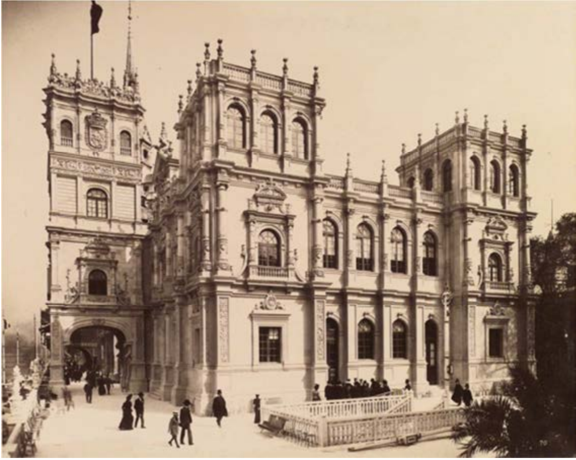
José de Urioste, Pavillon Espagnol. Exposition Internationale de Paris. 1900.