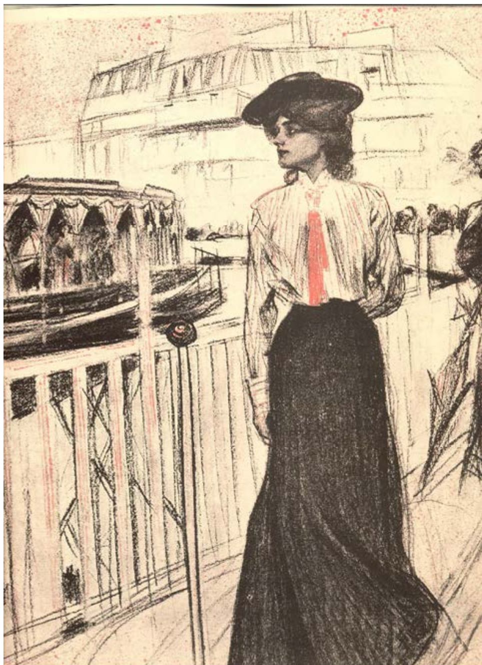
Ramon Casas, « La Plataforma mobible ». Pèl & Ploma , 57 (01/08/1900), p. 7