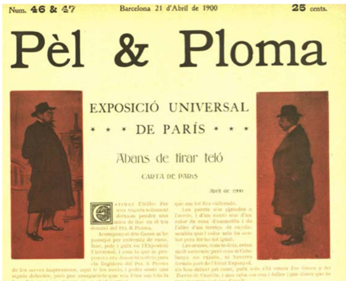
« Exposició Universal de París, Abans de tirar teló ». Pèl & Ploma , 46-47 (21/04/1900), p. 1