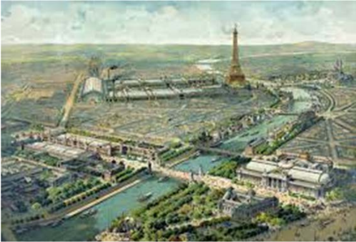
Lucien Baylac, Vue panoramique de l'Exposition universelle de 1900 . Lithographie, 72 x 93 cm. Collection particulière.