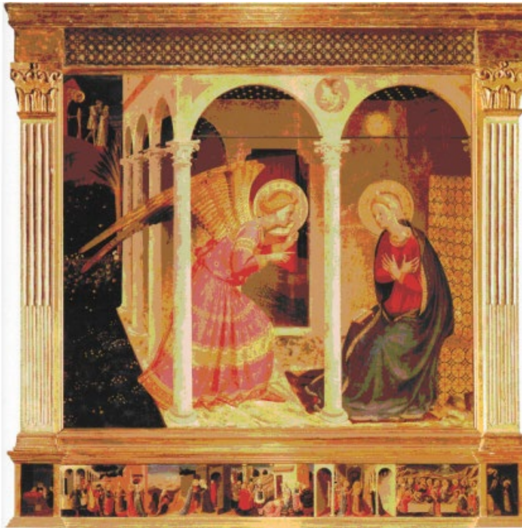
Fig. 2 : Fra Angelico, Annonciation (détail). Musée diocésain de Cortone.

Reproduction issue de l'ouvrage de G. Didi-Huberman, Fra Angelico, Dissemblance et figuration , p. 73. Crédit photographique Antella (Florence), Scala.