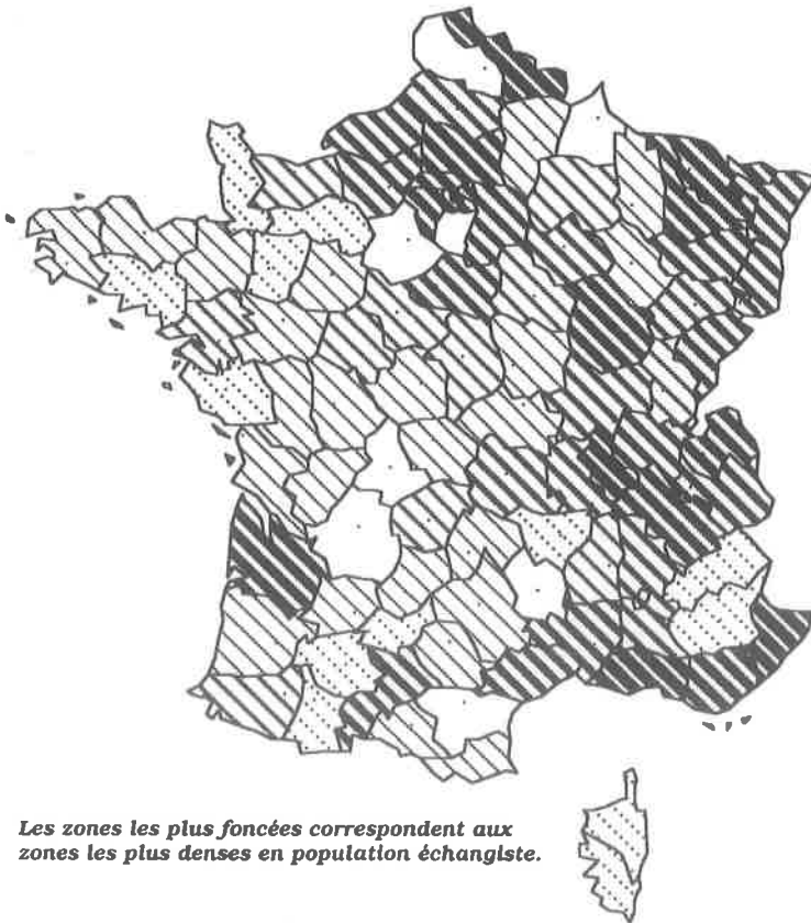
Carte de la population échangiste établie à partir de l'étude des petites annonces

Les zones les plus foncées correspondent aux zones les plus denses en population échangiste.