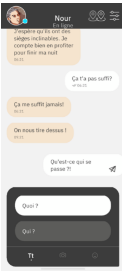
Figure 6. Différence de texte entre le choix fait et le message complet apparaissant.

Les notifications reçues à chaque manifestation de Nour arrivent au milieu des notifications personnelles. Comme les interfaces de messageries, elles affichent souvent les premiers mots ou premières lignes du message reçu. Parmi les nombreuses existantes, je citerai « MAAAADJ », « Merde ! », « Toujours pas de SIM, mais j'ai le Wifi », ou encore « Trouvé ! ». À l'opposé de ce mimétisme, si le lecteur s'absente du livre en plein échange ou durant un temps trop long, il recevra « Nour a besoin de vous ! » (Figure 7) ou, pour Lifeline , « Taylor vous attend. » (Figure 8) qui est bien moins immersif et intervient comme un rappel violent de la fiction dans la conversation, de l'impératif de suivre un rythme qui n'est pas naturel à cet instant de la vie réelle du lecteur. Il en va de même avec les pannes de batterie du communicateur de Lifeline , lorsque son panneau solaire ne fonctionne