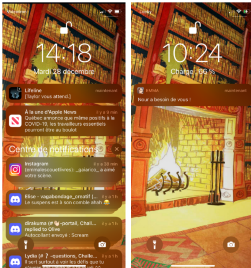
dans Enterre-moi, mon amour ; à droite, « Taylor vous attend. » dans Lifeline . Images produites par l'auteurice.

pas, où ses difficultés régulières à « accrocher le réseau » viennent interrompre une fluidité d'échange, tout autant que les absences pour aller effectuer une action.