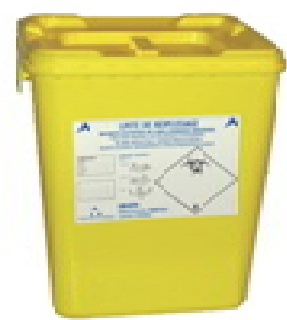
Boîte jaune = Objets Piquants Coupants Tranchants