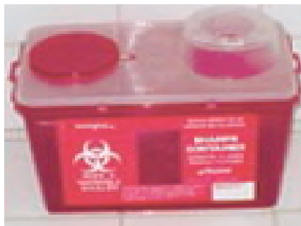
Boîte rouge = Déchets d'Activités de Soins à Risques Infectieux