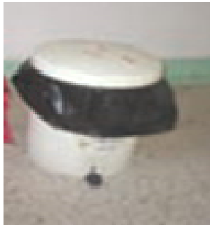
Sac noir = Déchets Assimilables aux Ordures Ménagères