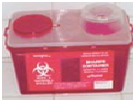
Boite rouge = Déchets d'Activités de Soins à Risques Infectieux