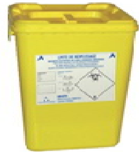
Boîte jaune = Objets Piquants Coupants Tranchants