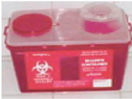
Boite rouge = Déchets d'Activités de Soins à Risques Infectieux