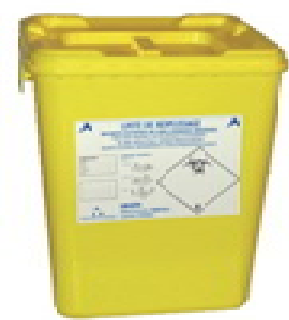
Boîte jaune = Objets Piquants Coupants Tranchants