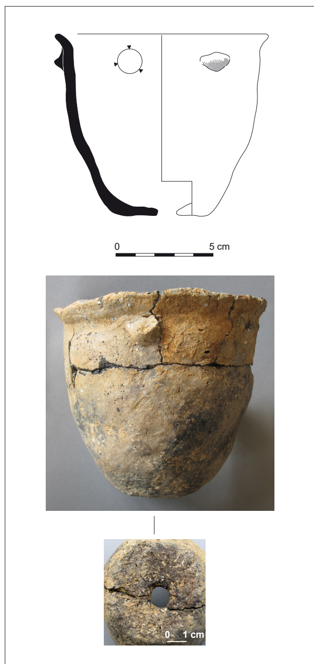
Fig. 2 – Dessin et vues du vase associé à la sépulture (dessin et clichés : K. Meunier, Inrap).

possible montage dans la masse. Puis, un ou deux colombins ont été ajoutés pour les 2 à 3 cm de la partie supérieure : sur le pourtour du récipient, une fracture suit le joint de colombin en forme de gouttière. Les surfaces ont été sommairement lissées, laissant les inclusions apparentes. La pâte est noire au cœur et sur la face interne, beige à gris-brun sur la face externe.