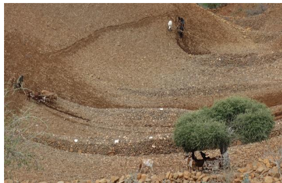
Figure 3. Labours dans la pierre.

Les systèmes d'entraide entre parents et voisins comblent les périodes creuses en assistant les personnes en difficulté, âgées ou malades. Idéalement restituée par la suite, cette aide communautaire s'est faite plus pressante avec l'enchaînement des sécheresses, et les uns n'ont plus les moyens d'aider quand les autres leurs rendent difficilement le geste, provoquant un malaise social pouvant mener à des tensions ou à leur (auto)exclusion, dont des départs en migrations. Ceux qui ne peuvent s'occuper de leurs terres établissent un kontract , bail emphytéotique qui met en métayage la terre contre une somme fixée en amont. Cette pratique, dans laquelle le loueur n'a aucune garantie de récupérer le terrain un jour, est une forme de vente déguisée de la terre car le rendement des parcelles est si faible qu'une famille qui loue sa terre perd son moyen de survie (Planel, 2016).