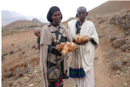
Figure 4. Les « poules du gouvernement ».

suivre les recommandations des AD et du wereda pour recevoir l'aide des ONGI », « Les gens qui travaillent dans les ONGI sont des fonctionnaires », etc. Alors qu'une ONGI distribuait des poulets pour développer l'aviculture à des paysans bénéficiaires de la PSNP, ces derniers les qualifiaient de « poules du gouvernement » ( yämängast doro ; figure 4).