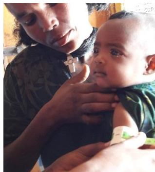
Figure 5. Prise de mesure du périmètre brachial par une ONGI.

Les activités plus urgentistes restent toutefois importantes et représentent environ deux tiers des programmes pour les trois ONGI citées. Elles sont menées auprès des centres de soin des kebeles où sont effectuées des mesure (prise de poids et du périmètre brachial, figure 5), le suivi (surveillance sanitaire et épidémiologique) et la distribution d'aide (aliments thérapeutiques prêts à l'emploi). Plusieurs directeurs d'ONGI faisaient toutefois remarquer que ces programmes sont récurrents (« on fait le même projet temporaire tous les ans depuis 30 ans », directeur ONGI, Sekota, 2017), ce qui révèle une insécurité alimentaire pérenne. Etablis sur des temps courts – car lancés sur appel du gouvernement éthiopien et financés par des bailleurs qui imposent des durées souvent limitées à 2 ou 3 ans – ils ne permettent pas à la population de sortir de sa précarité.