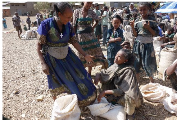
Figure 2. Vente de grains sur un marché local.

La ville de Sekota s'étire autour d'une rivière et d'une piste principale. Une présence musulmane, minoritaire mais importante, est matérialisée par une mosquée située au cœur de l'agglomération, parsemée également d'églises orthodoxes et animée par un foisonnant marché hebdomadaire (figure 2). Néanmoins, en dehors des petits commerces, des administrations et des ONGI, il est difficile d'y trouver du travail.