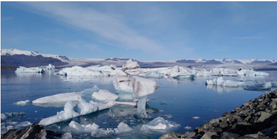
Figure 2: Le lac proglaciaire Jökulsárlón et ses icebergs. © J. Bussard, septembre 2020.

La marge proglaciaire est constituée d'une grande variété de formes telles que des crêtes morainiques, des eskers (crêtes de dépôts fluvio-glaciaires), des kames et des kettles (ensemble de collines et de dépressions formées par le dépôt de sédiments lors du retrait d'un glacier), des anciens lits fluviaux, des petits lacs proglaciaires et de nombreux placages morainiques, parfois flûtés ou assortis de drumlins (dépôts sous-glaciaires modelés sous forme de collines allongées par le passage du glacier). Ces formes relatent la dynamique passée du glacier et portent les traces des événements qui ont marqué la période de déglaciation. Elles ont fait l'objet de descriptions, d'analyses détaillées et de cartographies qui ont permis d'établir un modèle du fonctionnement des systèmes glaciaires actifs tempérés, sur la base du cas d'école que représente la marge proglaciaire du Breiðamerkurjökull (PRICE, 1969 ; EVANS,