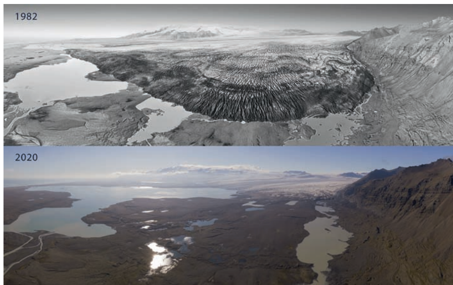
Figure 4: Le glacier Breiðamerkurjökull et le lac Jökulsárlón (à gauche) en 1982 et en 2020.

sans moyens de comparaison (figure 4) ou sans connaissance de la géomorphologie glaciaire, raison pour laquelle les personnes interrogées estiment à l'unanimité qu'il est important de développer des outils de médiation, constatant que les plateformes qui permettent de concrétiser la communication auprès du public sont presque inexistantes actuellement.