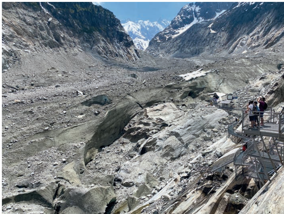
Figure 3 : Descente du Montenvers vers la grotte de glace. juin 2021.

représente 800 000 visiteurs par an (804 510 visiteurs en 2018). Cependant, ces chiffres additionnent l'ensemble des personnes transportées en train à la montée et à la descente. Il en résulte un double comptage qui surestime le nombre réel de visiteurs. Ainsi, les chiffres fournis par la Compagnie du Mont-Blanc indiquent que 391 549 personnes ont emprunté le train à la montée pour l'année 2018, auxquelles il faudrait ajouter les personnes montées à pied mais qui ne font pas l'objet de comptage. Au-delà de la vue sur le glacier, plusieurs itinéraires de randonnée sont possibles au départ de la gare d'arrivée, incluant des marches sur le glacier. Un petit centre d'interprétation glaciaire a été construit en 2012.