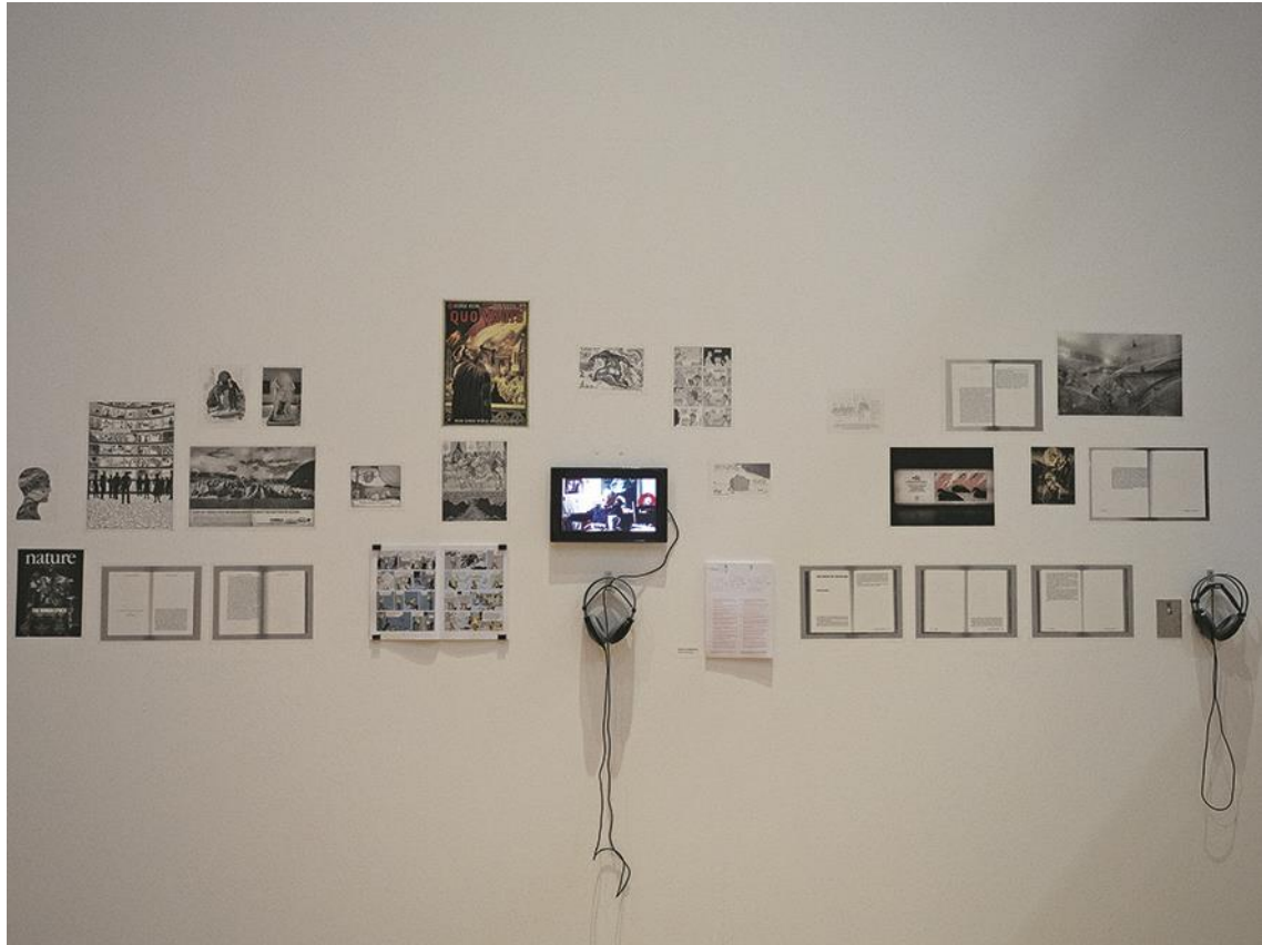
« Station documentaire C » dans l'exposition Reset Modernity! , ZKM, 2016.

moderne et contemporain, mais aussi d'identifier, sur chaque terrain d'enquête, les applications instrumentales ou spectaculaires de procédés ou d'inventions artistiques, afin de critiquer la discipline d'origine et de contribuer à sa transformation 33 .