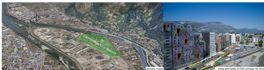
FIGURE 1. Le quartier "Cambridge" sur la presque-île Grenobloise

Dans nos travaux, nous nous sommes attachés à l'étude du nouveau eco-quartier "Cambridge" situé sur la presque-île de Grenoble. Ce quartier présente de nombreuses spécificités intéressantes. Tout d'abord, ses bâtiments sont récents (construction postérieure à 2015) et construits dans le respect de la RT2012. Ils sont également chauffés par des pompes à chaleur connectées à la nappe phréatique située directement sous la presque-île.