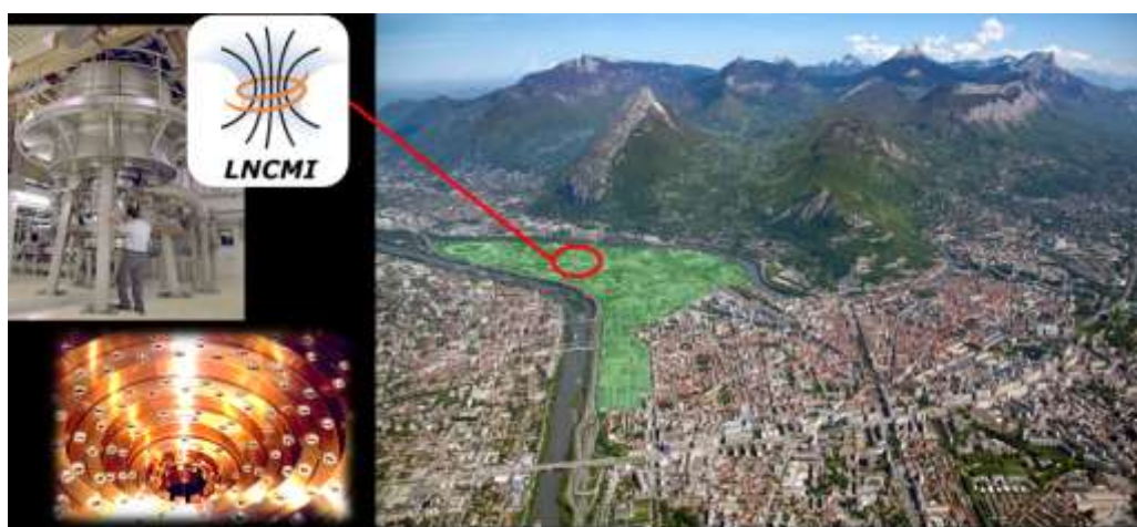
Figure 1 (de gauche à droite) : aimant dans son enceinte, vue du dessus d'un électro-aimant, localisation du LNCMI dans le quartier grenoblois de la Presqu'île.