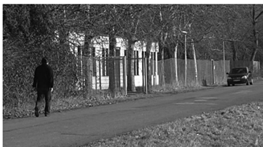
FIGURE 1 Screenshot of Type A Stimulus (Man Walking Toward a Car)