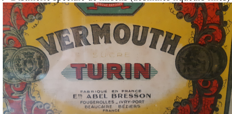
Figure 4 : une étiquette de Vermouth Bressano Turin.

L'absinthe et le vermouth font partie de ces nouvelles productions, et elles supplantent le kirsch. Fougerolles compte alors vingt-huit distilleries. Malheureusement pour ces producteurs, la fabrication de l'absinthe est interdite par la loi du 16 mars 1915, et la disparition de cet alcool a pour conséquence le déclin des distilleries de Fougerolles. L'importante distillerie d'Abel Bresson, qui dispose de plusieurs succursales hors de cette bourgade, prépare un vermouth qu'elle appelle "Vermouth Bressono Turin" (figure 4). Ses étiquettes mentionnent : "Distillerie Abel Bresson : "rectification d'alcool, fabrique d'absinthe suisse, distillerie de kirsch, maison à Genlis et Longeault, entrepôts : Valence, Montpellier, Le Havre, Lyon, Nice et Alger". Pour leur part, les établissements Patrice écrivent : "Distillerie d'absinthe supérieure Patrice et fils, spécialité de kirsch, Fougerolles" ; et les établissements Raimond Dufour : "Distillerie spéciale de kirschs (absinthes liqueurs fines)".