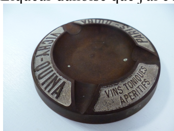
Figure 3 : un cendrier au nom de Vichy-Quina et Paris-Quina. Collection du Musée de la santé de Lorraine. Photographie P. Labrude.