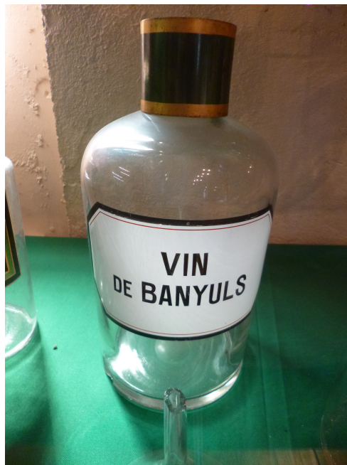
Figure 1 : une bouteille de vin de Banuyls provenant de la pharmacie de l'hôpital de Bruyères (Vosges), exposée au musée de cette ville.