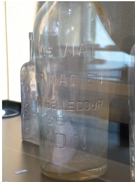
Figure 6 : une bouteille de vin de Vial présentée à l'occasion d'une exposition sur la verrerie et les conditionnements pendant la Première Guerre mondiale.

guerre de ce vin, avec soldat, convalescent, infirmière et allusion anti allemande sont nombreuses pendant le conflit.