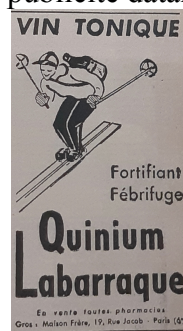
Figure 2 : une publicité pour le Quinium , présentée dans le journal Mode pratique le 14 septembre 1939. Archives départementales des Vosges, JPN 358/3, photographie P. Labrude.

Quinium Labarraque. "De la vigueur vin tonique, digestif, fébrifuge, approuvé par l'Académie de médecine, le plus actif des vins de quinquina", 25 f la bouteille, Maison Frère, 19 rue Jacob, Paris. Dû à Labarraque. Le document se vend dans les librairies spécialisées pour bibliophiles. Je présente ci-dessous une publicité datant de 1939 (figure 2).