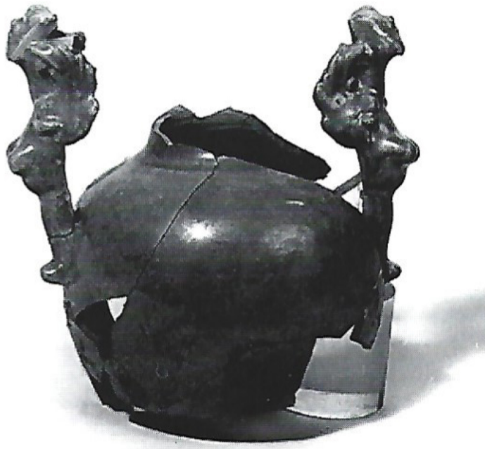
Fig. 98 : Digne, Notre-Dame du Bourg. Vase à anses en formes de figures féminines. Imitation de porcelaine Céladon. Importation italienne, Ligurie (?). XVIIe siècle.

compte encore quatre fabriques de potiers à terre en 1783, dont deux figurent sur le plan de la ville en 1765. En revanche Sisteron semble avoir perdu ses ateliers passé le XVIe siècle. Le seul artisan connu, mais d'importance, est François Auriol, potier-faïencier itinérant dont nous avons retracé une partie du destin ailleurs ( Un goût d'Italie ). Cet homme capable de réaliser les riches pavements du château de La Tour d'Aigues vécut sans doute plus prosaïquement de ce que lui rapporta son art d'escudellerie exercé à Aix-en-Provence ou de sa dextérité à tourner les borneaux des fontaines de Digne en 1581 11 . Il est d'ailleurs intéressant de souligner que cette ville ne connut finalement pas d'implantation pérenne de potier avant celle des Allard dont R. Zérubia nous parle ci-après, c'est-à-dire avant 1658. Ponctuellement cependant, la