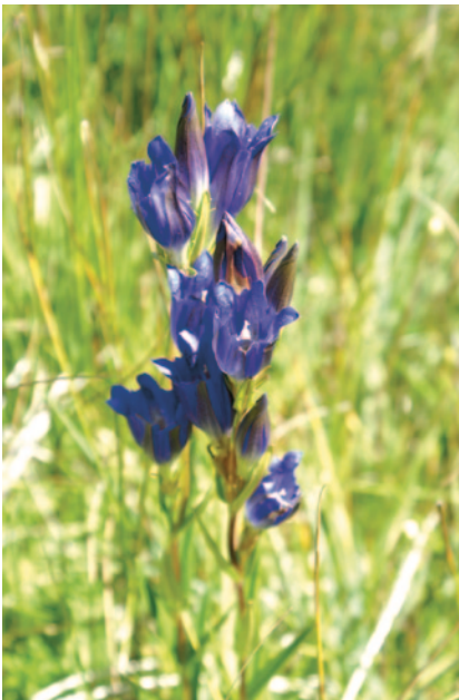
3- Gentiana pneumonanthe