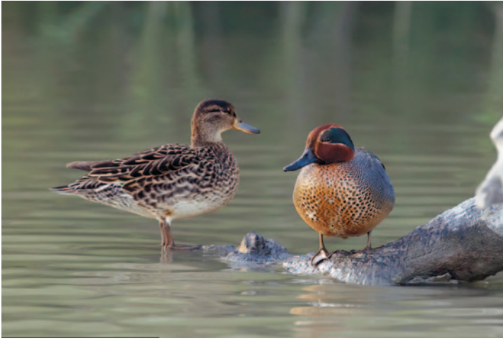
8- Couple des Sarcelles d'hiver, la femelle est à gauche