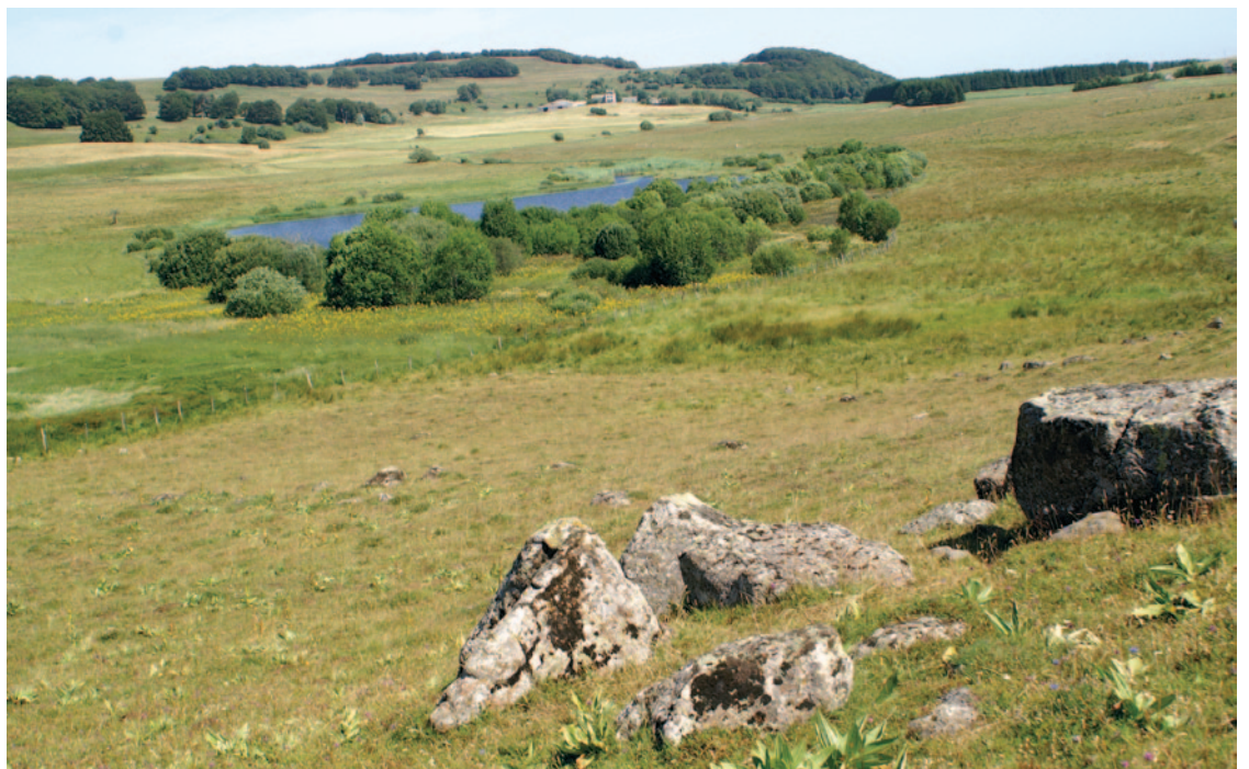
Fig 15 : Lac de Souveyrols

Aujourd'hui, le zonage et la charte ont été validés et le PNRA est en attente de création par le ministère de l'environnement (probablement au printemps 2018).