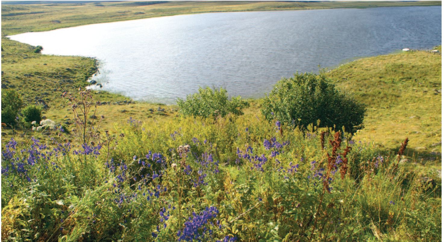
1 - Une riche biodiversité avec au premier plan une mégaphorbiaie à aconit napel et reine des prés

Dans cette seconde partie, c'est un autre facteur d'attachement et de patrimonialisation qui va être évoqué, la richesse naturelle, faunistique et floristique du lac et de ses abords, qui a apporté au site diverses reconnaissances. Cette richesse est le fruit de pratiques anciennes ou nouvelles, qui peuvent constituer ou non des facteurs d'entretien de cette diversité : certains usages actuels comme le tournage de films valorisent le site sans lui porter atteinte, alors que la collecte sauvage de plantes par des touristes peut lui porter préjudice. Il s'agit néanmoins d'un patrimoine reconnu, qui de ce fait est l'objet de diverses politiques publiques de gestion de la biodiversité, dans le but d'en préserver la richesse.