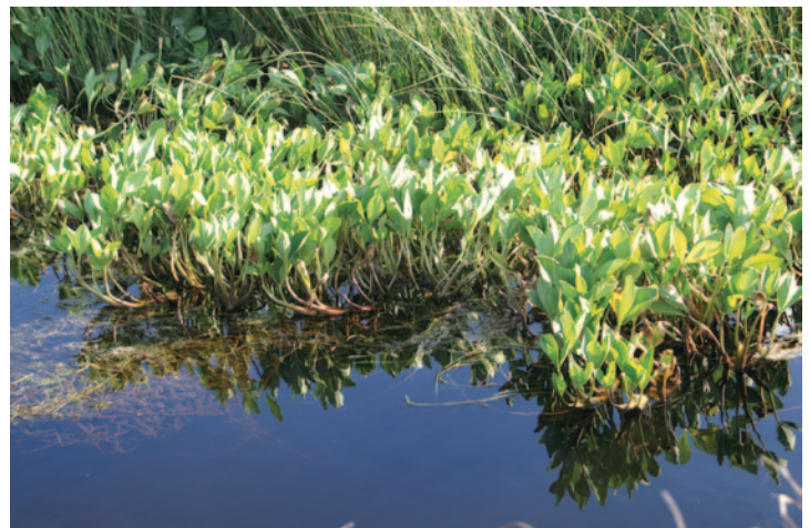
7- Menyanthes trifoliata