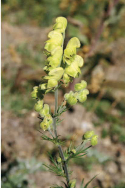
2- Aconitum anthora

Dans le lac, on peut observer deux espèces d'isoètes ( Isoetes lacustris , Isoetes echinospora ) et la littorelle ( Littorella uniflora ). Le fluteau nageant ( Luronium natans ) est une espèce aquatique très localisée sur le lac (non revue récemment). Dans les zones humides proches, on peut citer Drosera rotundifolia , Aconitum napel , Aconitum anthora , Pedicularis foliosa , ces deux dernières espèces étant très rares et très localisées en Lozère.