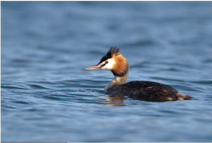
10- Grèbe huppé