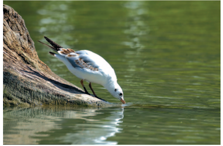
9- Mouette rieuse avec son plumage d'hiver