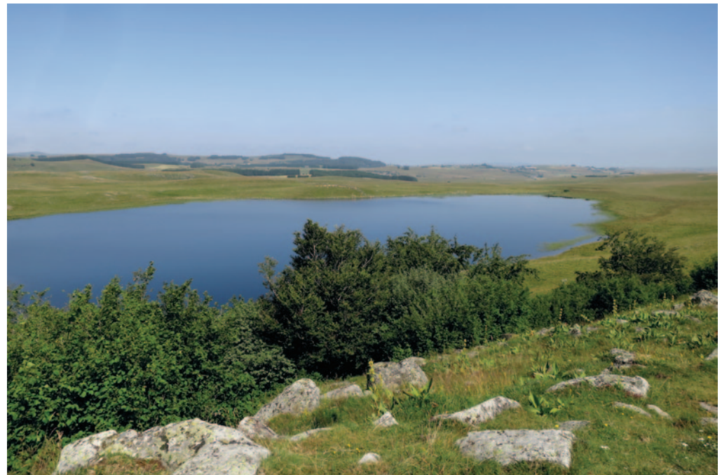
Fig 17 : Lac de Saint Andéol) (Cliché : Bertrand Desailly)

Objet hier comme aujourd'hui de multiples usages, le lac de Saint-Andéol leur doit, tout autant qu'à la nature, sa richesse et sa beauté. Richesse et beauté fragiles cependant, méritant d'être protégées.