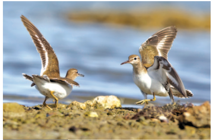
11- Couple de Chevaliers guignette