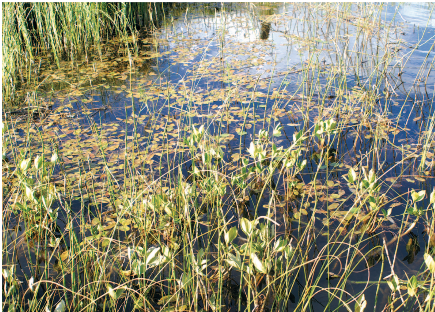
12- Phragmitaie et végétation flottante à potamot