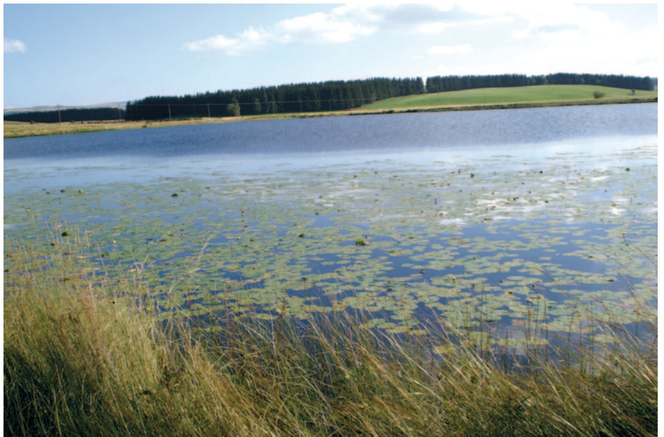
Fig 13 : Lac des Salhiens

Dans un autre registre, le lac de Saint-Andéol est par ailleurs classé à l'inventaire des sites 3 au titre de la Loi du 2 mai 1930 depuis le 2 novembre 1942, tout comme le Lac de Salhiens et la Cascade du Déroc.