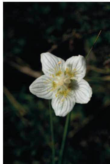
4- Parnassia palustris (Cliché : Gérard BRIANE)