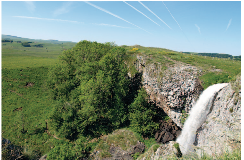
Fig 14 : la cascade du Déroc

Depuis novembre 2012, l'Aubrac Lozérien, caractérisé par une richesse paysagère, faunistique et floristique importante, issue de son passé volcanique, glaciaire mais aussi agricole, bénéficie d'une Charte Natura 2000 4 qui s'applique à l'ensemble du site Natura 2000 « Plateau de l'Aubrac ». Ce site a pour ambition la préservation et la valorisation de ces habitats naturels et espèces remarquables. Ainsi deux inventaires successifs ont permis d'identifier et de cartographier les différents habitats et les espèces végétales d'intérêt communautaire : la ligulaire de