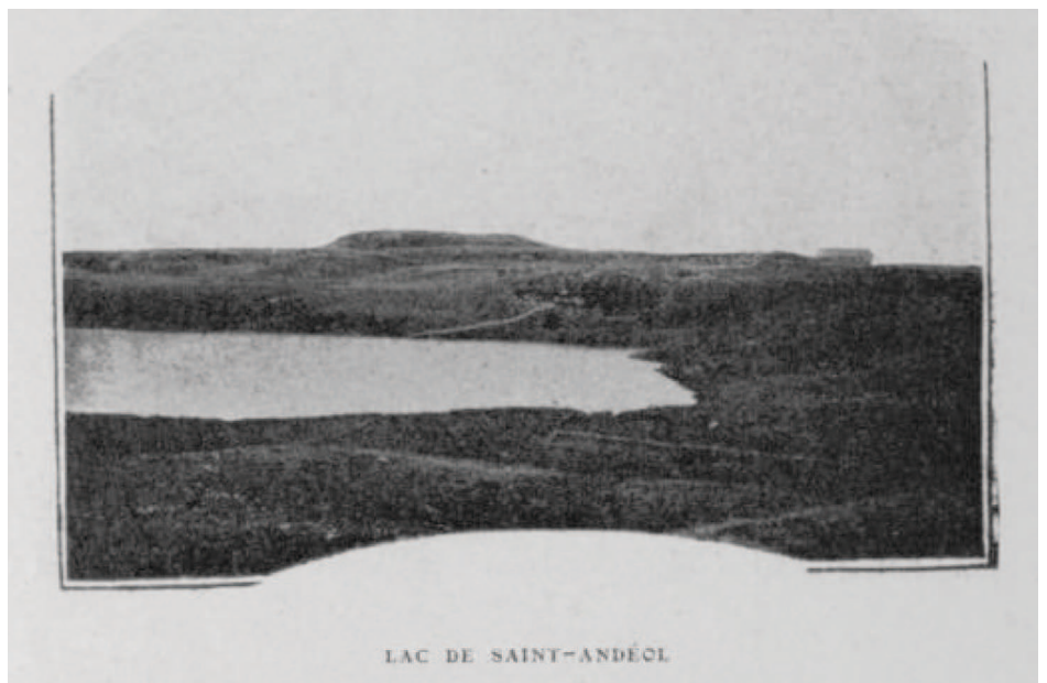
Fig. 7 : Le lac de Saint-Andéol vers 1908.

Une photographie du lac de Saint-Andéol figure par ailleurs dans un numéro daté de 1908 de la revue du Club Cévenol , publiée à Alès. Le cliché a été pris depuis l'ouest du lac. La qualité de reproduction est médiocre et ne permet pas de déterminer avec précision le couvert végétal autour du lac, qui semble cependant correspondre à des pelouses. Au fond se détache la montagne de Cap Combattut, promontoire tabulaire basaltique, où ont été découverts en 1953 les vestiges d'un sanctuaire gallo-romain ( Fau et al., 2010 ). On distingue en outre, au centre de la photo et suivant la pente, le tracé en diagonale d'un muret de pierres sèches délimitant deux parcelles cadastrales. Ce muret existe toujours aujourd'hui.