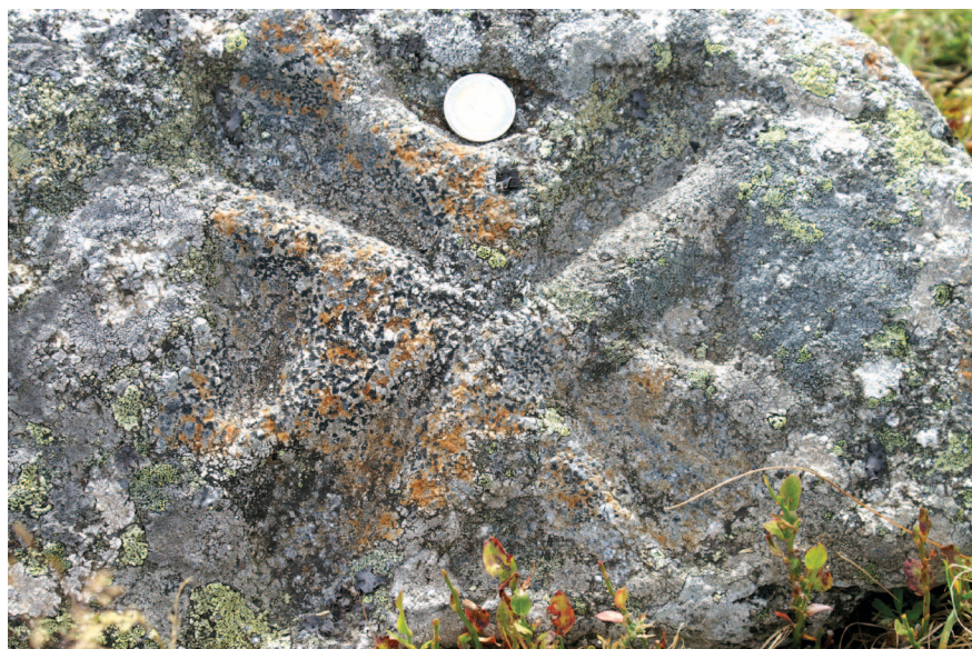
Fig. 5 : Photo des croix templières puis hospitalières (Cliché : G. BRIANE, juillet 2016)

D'un haut lieu à caractère essentiellement religieux, le lac de Saint-Andéol bascule au cours du XIX e siècle dans la catégorie des sites à valeur scientifique. Des botanistes y font des relevés au milieu du siècle. Clavel (1855) affirme avoir fait arracher des rives du lac en 1835 des tronçons de racine de Nymphæa alba major « plus gros que la jambe ». La description faite par Gay