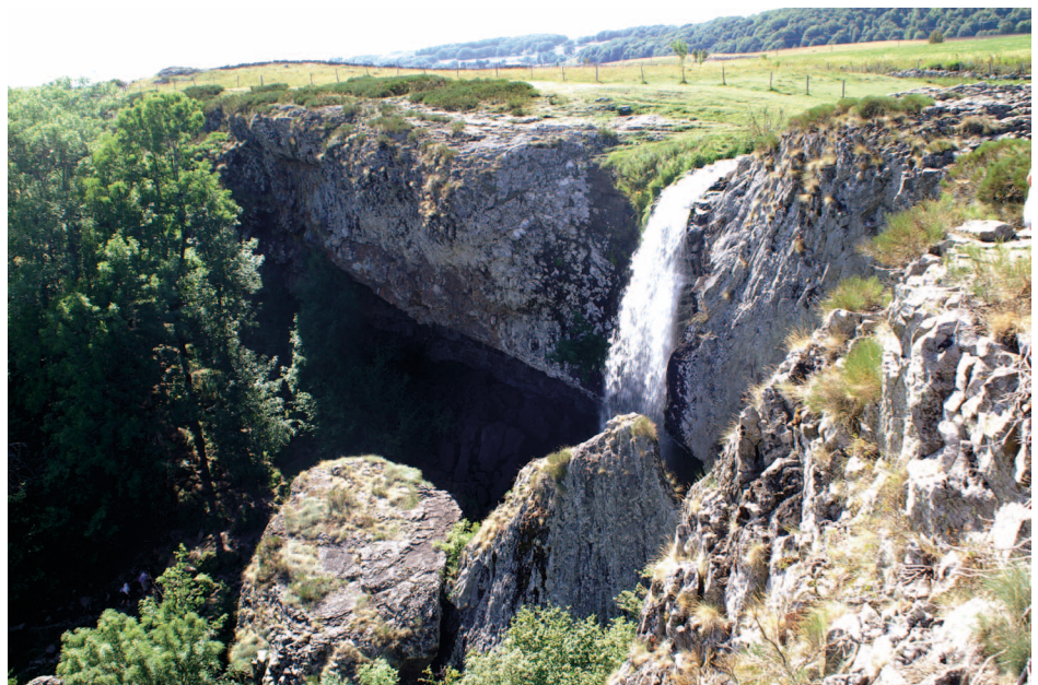
Fig. 10 : Cascade de Déroc (Cliché : G. BRIANE, août 2010)