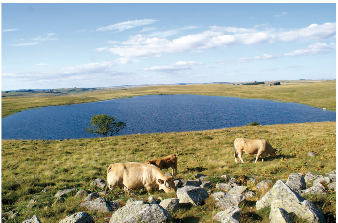
Fig. 8 : Lac de Saint-Andéol (Cliché : G. BRIANE, août 2010)

Un autre type d'espace boisé, en revanche, n'a connu aucun changement sur l'ensemble de la période : le petit bois de la Picade et ses annexes, sur le versant dominant à l'ouest le lac de Salhiens, peuplé de hêtres.