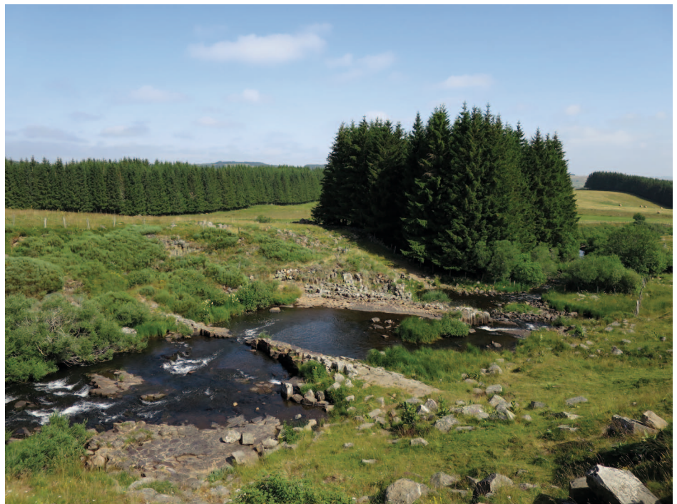
Fig. 9 : Reboisements en épicéas réalisés dans les années 1960-1970