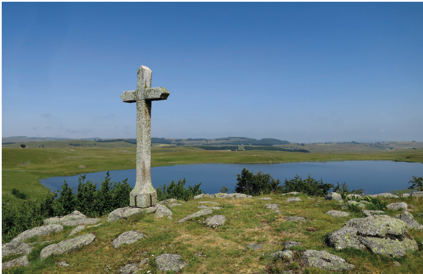
Fig. 1 : Le lac de Saint-Andéol

Texte : Bernard Alet, Alexandra Angéliciaume-Descamps, Gérard Briane et Bertrand Desailly maîtres de conférences au Laboratoire GEODE UMR 5602 CNRS, Université Toulouse Jean-Jaurès)