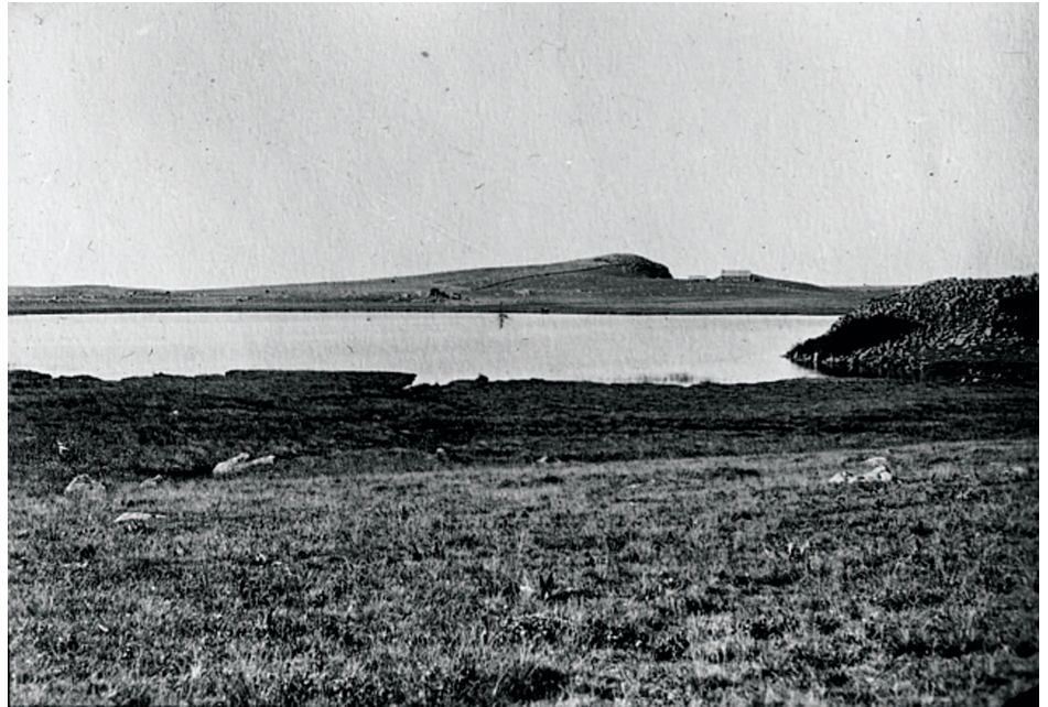
Fig. 6 : Le lac de Born vers 1898. La photo comporte la légende suivante : « France : Massif central : Auvergne : Aubrac : Lac de Bord, montagne de Perpiou ».

La première est une plaque de verre appartenant au fonds documentaire du laboratoire PRODIG UMR 8586. Son auteur est inconnu. La photographie est un plan large du lac de Born, prise depuis le sud du lac en direction du nord. On distingue clairement, à l'arrière-plan, la silhouette dissymétrique de la montagne du Peyrou, culminant à 1289 m, avec à son pied le buron de Born, aujourd'hui transformé en restaurant. Au centre de la photo, les rives plates et marécageuses du lac se détachent de la pelouse en pente du premier plan. Comme aujourd'hui, l'arbre et même l'arbuste brillent par leur absence.