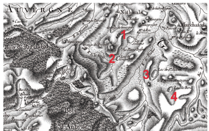
Fig. 3 : Le sud du plateau de l'Aubrac au milieu du XVIII e siècle d'après la carte de Cassini. Les lacs de Salhiens (1), de Souveyrols (2), de Saint-Andéol (3) et de Born (4) sont représentés dans un environnement dépourvu d'arbres comme aujourd'hui. La forêt d'Aubrac, au sud-ouest, est en revanche bien présente.

La monographie de la commune de Marchastel rédigée en 1874 par l'instituteur Ajasse 5 évoque quant à elle un lieu « remarquable en faits historiques et légendaires », indication absente de la description du lac voisin de Born. L'auteur signale par ailleurs les nombreuses vertus thérapeutiques attribuées à ses eaux par la population locale, principalement pour le traitement des rhumatismes et de la teigne chez les enfants. Dans le même esprit, on attribuait au lac de Saint-Andéol et aux lacs voisins des vertus guérisseuses et de fertilité (P. Saintyves, 1933), que relayent certains locaux. La dévotion de la paroisse de Marchastel pour Saint-Andéol s'exprimait par une procession jusqu'aux rives du lac le lundi de Pentecôte, destinée à préserver les récoltes des orages dont les habitants attribuaient au lac l'origine. Malafosse évoque, dans sa monographie du Plateau des lacs en Aubrac (1901), d'autres festivités organisées en cet endroit le second dimanche d'août.