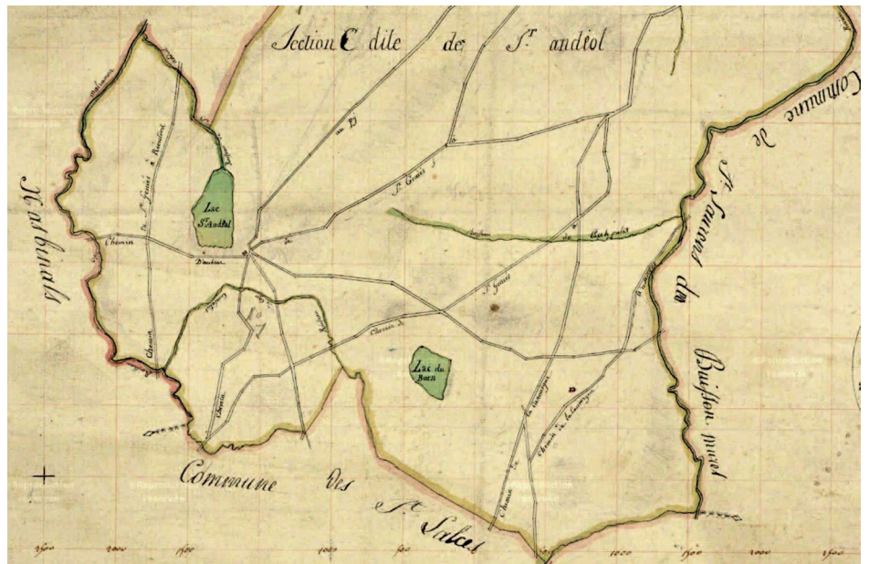
Fig. 4 : Plan cadastral de Marchastel, section C dite de Saint-Andéol, 1813 (extrait).

truites saumonées dans le lac de Saint-Andéol et carpes dans le lac de Born. Ces dernières y auraient été introduites par les moines d'Aubrac.