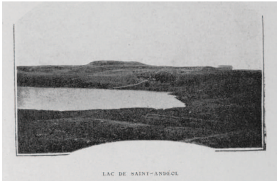
Fig. 7 : Le lac de Saint-Andéol vers 1908. (Source : Club cévenol : Causses et Cévennes. Revue trimestrielle illustrée , 14 ème année, 1908.)

Une photographie du lac de Saint-Andéol figure par ailleurs dans un numéro daté de 1908 de la revue du Club Cévenol , publiée à Alès. Le cliché a été pris depuis l'ouest du lac. La qualité de reproduction est médiocre et ne permet pas de déterminer avec précision le couvert végétal autour du lac, qui semble cependant correspondre à des pelouses. Au fond se détache la montagne de Cap Combattut, promontoire tabulaire basaltique, où ont été découverts en 1953 les vestiges d'un sanctuaire gallo-romain ( Fau et al., 2010 ). On distingue en outre, au centre de la photo et suivant la pente, le tracé en diagonale d'un muret de pierres sèches délimitant deux parcelles cadastrales. Ce muret existe toujours aujourd'hui.