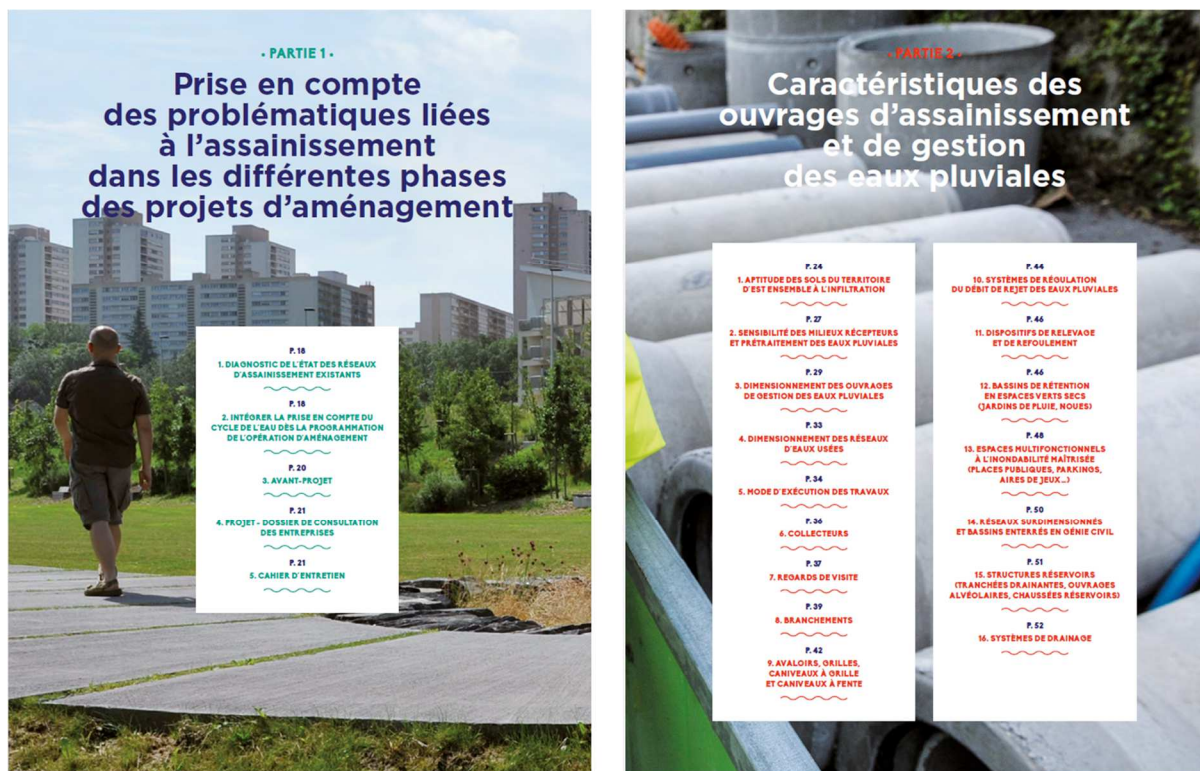
Figure 2 Extrait du guide Aménagement urbain, assainissement et gestion des eaux pluviales sur le territoire d'Est-Ensemble [EST ENSEMBLE, 2016].

La rétrocession d'ouvrages est de fait un autre levier d'action pour les collectivités : elles peuvent accepter ou non cette rétrocession, et imposer des conditions à la reprise des ouvrages. La communauté d'agglomération de Cœur d'Essonne s'est par exemple dotée d'un document de préconisations pour la rétrocession des bassins de retenue. Ceci permet notamment aux collectivités de peser dans les aménagements des lotissements et zones d'activités économiques (de compétence intercommunautaire pour ces dernières), dont les ouvrages sont souvent rétrocédés pour gestion, avec les espaces communs. La communauté d'agglomération d'Agen, celle de Châteauroux et le syndicat intercommunal du bassin d'Arcachon négocient la création de bassins de rétention végétalisés et de noues dans les lotissements et les zones d'activité. Lotissements et zones d'activités sont d'autant plus intéressants que le foncier n'y est pas trop contraint et peut être mobilisé pour des aménagements de gestion des eaux pluviales en surface.