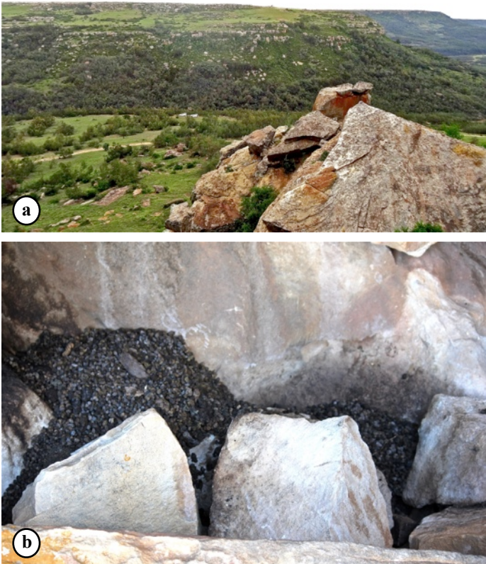
Fig. 13. – a : Eastern Cape (Afrique du Sud), affleurement rocheux abritant la colonie de Damans des rochers (alt. 1615 m) où ont été collectés les spécimens de Chaetabraeus francoisi n. sp. – b : Latrines de Damans des rochers, Mzimkhulu river, Gudlucingo (alt. 341 m), KwaZulu-Natal, Afrique du Sud (Sébastien Rojkoff, 7-XII-2016).

Pronotum . – Angles antérieurs sans tubercule proéminent (Fig. 22). Ponctuation du disque simple ou de taille assez uniforme, d'aspect identique à la base et au sommet, les points les plus gros distants de 0,5 à 1 diamètre. Rebords latéraux du pronotum sans petits tubercules saillants visibles. Carène longitudinale des propleures présente (Fig. 25), plus proche du bord inférieur que du bord supérieur (bord du pronotum), parallèle au bord du pronotum en avant , nettement détachée de la marge inférieure des propleures, surtout en avant, son extrémité antérieure non incurvée. Espace entre le bord pronotal et la carène propleurale plan, d'aspect chagriné, à ponctuation indistincte. Strie anté-scutellaire absente , en vue dorsale et lumière rasante postérieure. Points alignés longeant la base du pronotum ronds ou ovales, de taille égale à ceux du disque (Fig. 23).