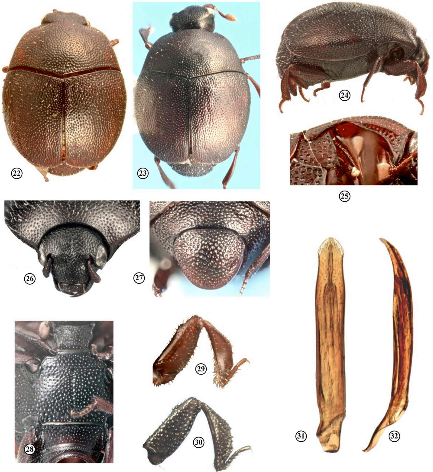
Planche III - Fig. 22 - 32. - Chaetabraeus (s. str.) johnstoni n. sp.

Fig. 22. – Habitus en vue dorsale, holotype mâle. Fig. 23. – Habitus en vue dorsale d'une femelle. Fig. 24. – Habitus en vue latérale d'une femelle. Fig. 25. – Propleure du mâle. Fig. 26. – Avant-corps et tête. Fig. 27. – Pygidia. Fig. 28. – Sterna en vue ventrale, holotype mâle. Fig. 29. – Patte antérieure de l'holotype en vue dorsale. Fig. 30. – Idem en vue ventrale. Fig. 31. – Paramères de l'édéage en vue ventrale. Fig. 32. – Paramères de l'édéage en vue latérale.