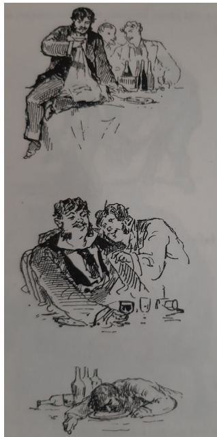
« Illustration “De la mesure” », Bertall, La Vigne, voyage autour des vins de France. Étude physiologique, anecdotique, humoristique et même scientifique , Paris, E. Plon & Cie, 1878, p. 33.